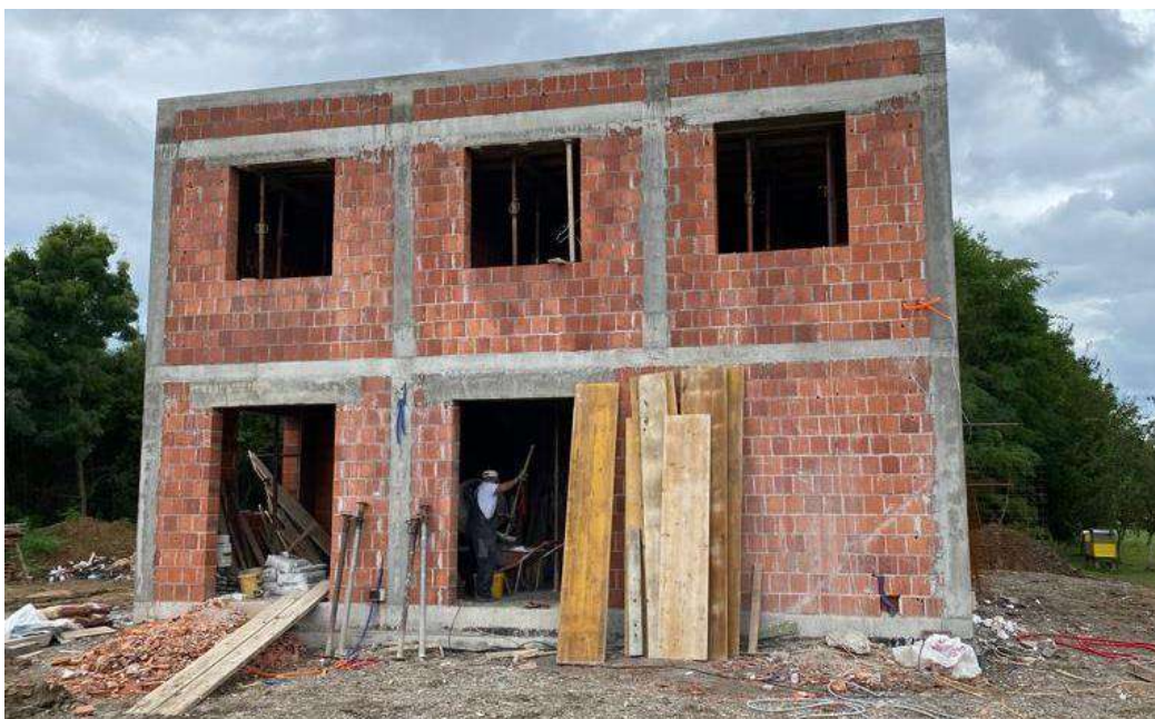
Slika 32. Čeona strana zgrade, završeni armiranobetonski i zidarski radovi

Do sada su prikazani svi glavni armiranobetonski i zidarski radovi. Zbog ponovljivosti procesa proizvodnje na etaži prizemlja i prvog kata više se neće obrađivati već prikazani radovi.