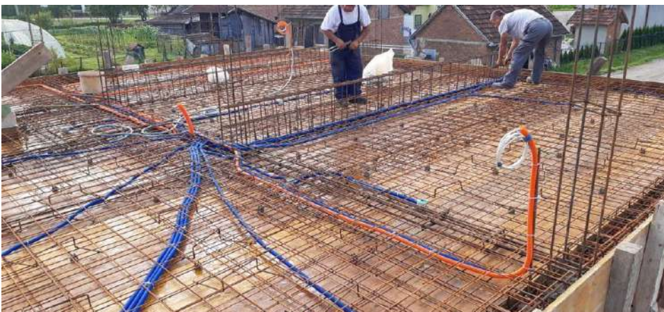
Slika 24. Armatura i oplatni sustav ploče, kontragreda i horizontalnih serklaža