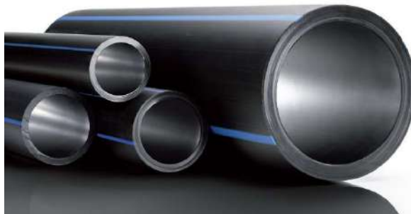
Slika 2: PEHD cijev

Rješenje vodoopskrbe naselja Grubišno polje predviđeno je cjevovodom čiji promjer iznosi DN 180, a hidrodinamički tlak na čvoru iznosi p = 2.5 [bar]. Ukupna duljina vodoopskrbne mreže iznosi 9204.9 metara. Izvedba cijelog opskrbnog vodovoda obavlja se plastičnim vodovodnim cijevima (PEHD) promjera DN 110 i DN 180 te nazivnog tlaka PN 10. [2] Sastojci PE su jedino ugljik i vodik bez drugih dodatnih sastojaka, što znači da nema utjecaja na okoliš. Karakterizira ih mala masa i faktor trenja, fleksibilnost, postojanost prema utjecajima okoliša, kemijska postojanost, dugotrajna hidrostatska čvrstoća i nepropusni spojevi te sposobnost zavarivanja. Na karakteristike polietilena ne utječe slana voda, razni otpadi te slani i kiseli tereni što znači da se može ugraditi i u agresivnim sredinama. PE cijevi mogu biti jednoslojne ili višeslojne, a ako su višeslojne potrebna je vanjska zaštitna obloga od polipropilena. Također, razlikujemo dva načina spajanja PE cijevi: rastavljivi spojevi (rastavljivi fitting, spajanje prirubnicom...) i nerastavljivi spojevi (elektrospojnice, sučeono zavarivanje...). [2][3] Za protupožarnu zaštitu izvode se nadzemni hidranti promjera DN 110 na maksimalnom razmaku od 300 [m] prema Pravilniku o hidrantskoj mreži za gašenje požara („Narodne novine RH“, broj 8/06) . [4]