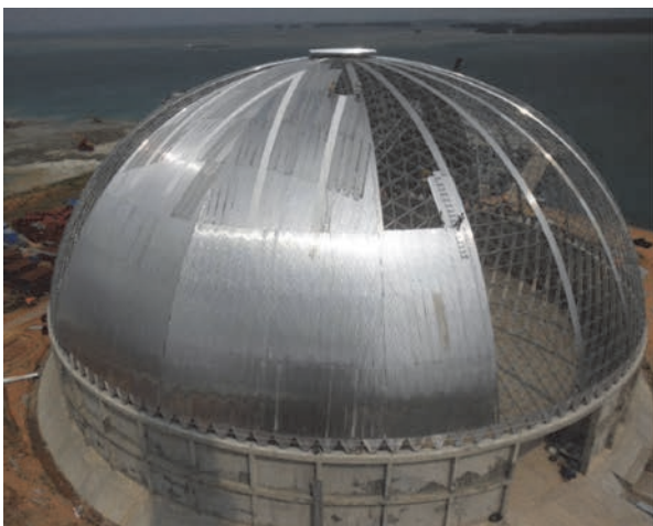
Slika 7. Aluminijaska kupola za skladištenje ugljena

Postoje posebne konstrukcije koje imaju funkciju nošenja fiksnih elemenata, koji se nalaze na određenoj udaljenosti