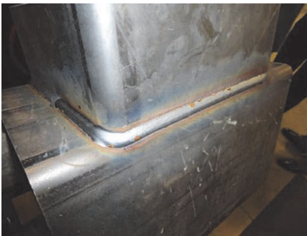
Slika 2. Konstrukcijski element iz hladno oblikovanog pravokutnog šupljeg profila zavaren po cijelom opsegu profila [3]

Slijedom navedenog, može se zaključiti da je zavarivanje hladno oblikovanih šupljih profila proizvedenih prema EN 10219, ako su zadovoljeni gore navedeni uvjeti, dopušteno po cijelom opsegu profila. Na slici 2. prikazana je izvedba kvalitetno izvedenog vara kod hladno oblikovanog pravokutnog šupljeg profila po cijelom opsegu profila.