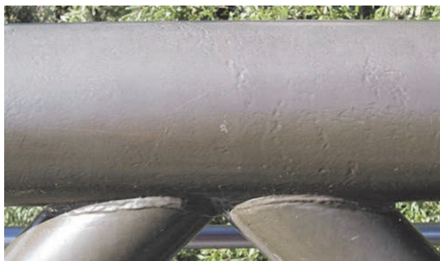
Slika 1. Detalj čvora izvedenog iz tople dogotovljenih šupljih profila s vidljivo izbrazdanom površinom [3]