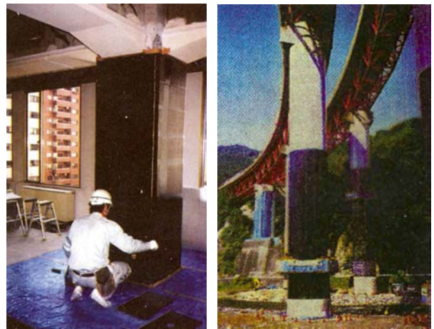
Slika 1. Ojačanje PAV plahtama: (lijevo) stupa, (desno) stupova vijadukta

te ovije čelikom ili trakama od PAV-a, s tim da se stup, kvadratnog ili pravokutnog presjeka, dodavanjem novog betona oblikuje u kružni odnosno eliptični presjek, kako bi se ovijanjem postigla djelotvornost što bliža onoj kada se ovija kružni presjek. Kako je ovaj način ojačavanja skup te ima za posljedicu loš estetski izgled stupa proširenog u području plastičnog zgloba i nešto malo izvan njega, ovaj način poboljšavanja svojstava stupa rijetko se primjenjuje. Najnoviji prijedlog ojačavanja kvadratnih i pravokutnih stupova, na osnovi teorijskih i eksperimentalnih istraživanja, nudi primjenu traka od polimera armiranog vlaknima (PAV) i bez zapaženije promjene izmjera stupa (slika 1.).