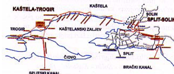
Slika 1. Kanalizacijski sustav

Daljnji zadatak u pripremi bilo je istraživanje kapaciteta ovih kanala za prijem zagađenja, njegovu osjetljivost, a time i na definiranje odnosa stupnja pročišćavanja i dispozicije otpadnih voda podmorskim ispustima. Rezultat ove studije i glavni zaključci su da oba kanala mogu primiti mnogo veću količinu otpadne tvari bez bojazni od posljedica na ekološki sustav mora. Time je omogućena fazna izgradnja uređaja za pročišćavanje otpadnih voda.