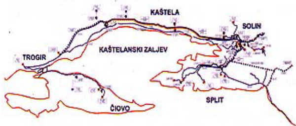
Slika 2. Vodoopskrbni sustav Split-Solin-Kaštela-Trogir

Postojeći vodoopskrbni sustav za područje gradova Splita, Solina, Kaštela i Trogira bazira se na zahvatu vode na izvoru rijeke Jadro u Solinu i dovođenju vode do mjesta potrošnje putem gravitacijskih kanala i u smjeru Splita i za smjer Solin – Kaštela – Trogir.