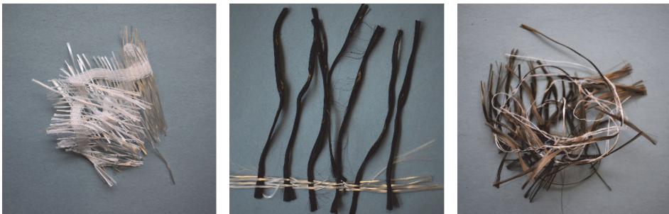
Slika 1. Otpadna vlakna dobivena u proizvodnji mrežica za građevinarstvo; s lijeva na desno: staklena, ugljična, bazaltna vlakna

Prema anketama provedenim u sklopu projekta ReWire među proizvođačima mrežica za građevinarstvo, dobiven je podatak da se samo na području Hrvatske generira približno 327 tona otpadnih vlakana godišnje, odnosno 10 % korištene vrijednosti [19]. Otpad se skladišti u spremnicima i odlaže na odlagalištu. Sve to predstavlja trošak za proizvođača, a istovremeno nije u skladu s Direktivom o otpadu [20].