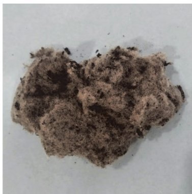
Slika 2. Odnos vrsta ponovnog iskorištavanja otpadnih guma u Hrvatskoj (lijevo); onečišćena polimer- na vlakna dobivena recikliranjem otpadnih guma (desno)