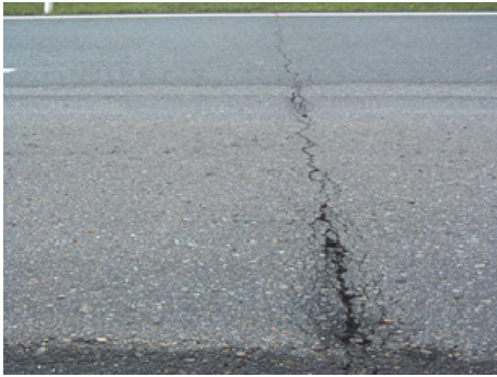
Slika 2. Izražajna strukturna pukotina [4]