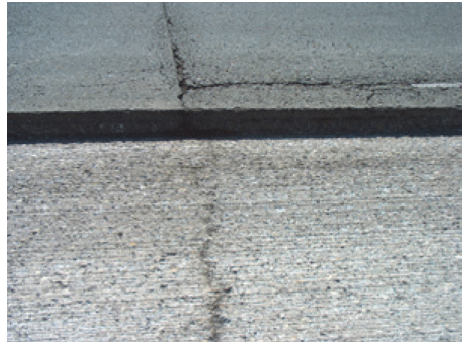
Slika 3. Poprečna i uzdužna pukotina [4]

Provedena istraživanja armaturnih mreža bila su usmjerena na utjecaj veličine otvora, materijala od kojeg je mreža proizvedena, ugradnje mreže na povezivanje slojeva u kolničkoj konstrukciji i slično.