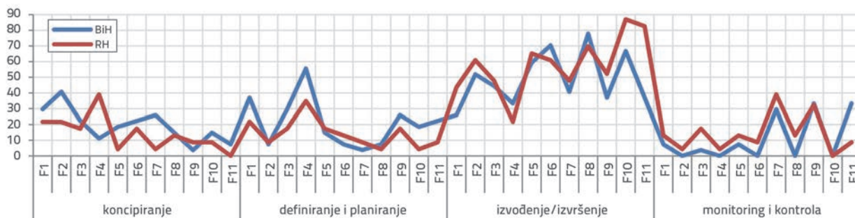
Slika 3. Važnost ključnih faktora po fazama projekta prema izvođaču... u BiH i RH