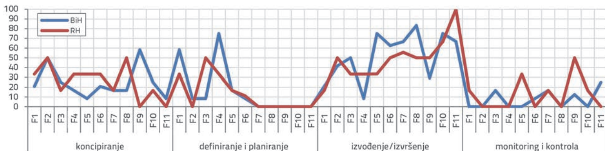
Slika 2. Važnost ključnih faktora prema investitoru u BiH i RH

Na osnovi analiza pokazalo se da postoje očite razlike u shvaćanju važnosti svakog pojedinačnog ključnog faktora kvalitete tijekom faza projekta i od strane različitih sudionika u projektu (slike 2. do 5.). Za faktor F1 (planiranje i kontrola) u BiH investitori, izvođači i voditelji projekta smatraju da je za fazu definiranja i planiranja ovaj faktor najvažniji, dok u