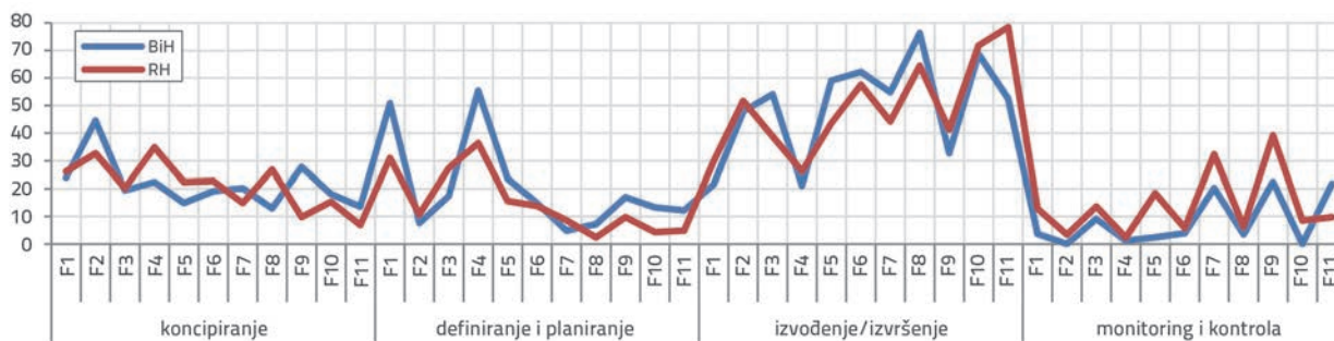
Slika 5. Važnost ključnih faktora po fazama projekta prema svim sudionicima u BiH i RH