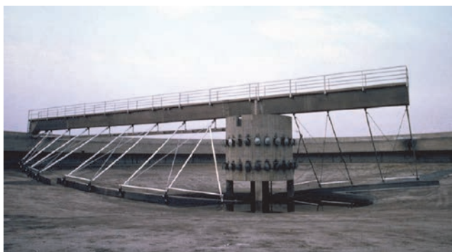
Slika 9. Bazen postrojenja za pročišćavanje otpadnih voda Po-Sangone , Torino, Italija

Područje gdje svojstva aluminija imaju ključnu ulogu je – hidraulička primjena (cjevovodi, spremnici). Slučaj rotirajuće mosne dizalice za velike taložne kružne bazene kod postrojenja za pročišćavanje otpadnih voda tipičan je primjer. Konkretno, "otpornost na koroziju" omogućuje uklanjanje bilo kakve zaštite i kod prisutnosti od korozivnog okruženja, dok "lakoća" (mala težina) odgovara štednji energije tijekom faza rada postrojenja (slika 9.).