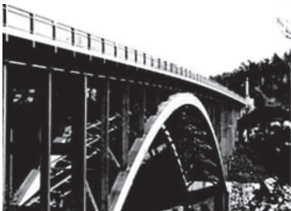
Slika 11. Most Arvida u Quebecu, Kanada