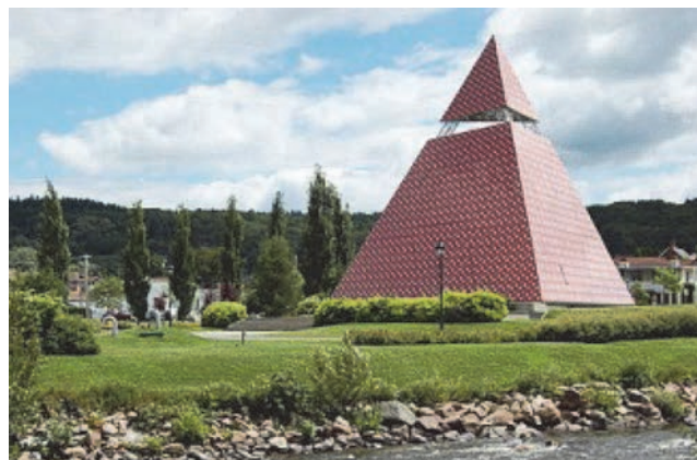
Slika 5. Spomen-piramida u La Baie, Quebec, Kanada

Mrežaste kupole predstavljaju najizazovnije primjene aluminijskih legura u području građevinarstva - konstrukcijskog inženjerstva, omogućujući realizaciju važnih građevina