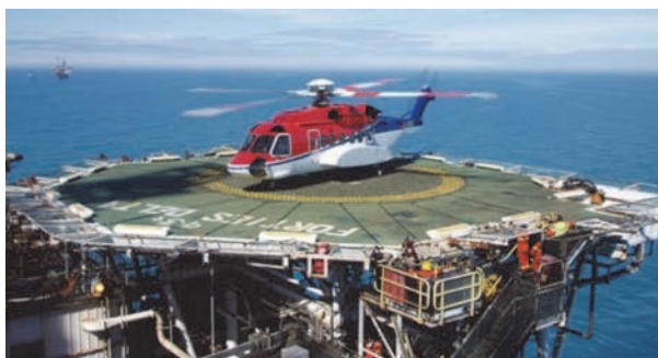
Slika 10. Platforme za helikoptere

Izgrađene su sve vrste mostova koristeći aluminijske legure. Most Arvida u Quebecu, Kanada, (1950.) izazovni je prototip