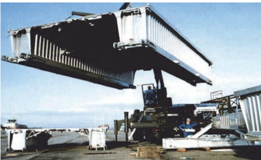
Slika 13. Njemački vojni most tijekom montaže

Pješački most je s obzirom na nisko pokretno opterećenje tip konstrukcije gdje se aluminijske legure uspješno koriste. Dodatne prednosti zahvaljujući "lakoći" očite su na primjeru pokretnih mostova. Primjeri aluminijskih pješačkih mostova mogu se naći u Francuskoj, Njemačkoj, Nizozemskoj, Italiji i u Kanadi.