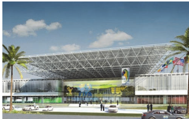
Slika 3. Međunarodni kongresni centar u Rio de Janeiru, Brazil / simulacija rekonstrukcije

U potpunosti je spojena vijcima na tlu, i kasnije je podignuta na završnu razinu od 14 m pomoću 25 dizalica smještenih u uglovima mreže, na mjestima stvarnih oslonaca. Težina od konstrukcije je 16 kg/m 2 ; broj elemenata je 56.820 i njihova ukupna duljina je 300 km. Vrijeme montaže je izuzetno kratko (27 sati), a upotrijebljeno je 550.000 vijaka u 13.724 čvora. Materijali su: legure aluminija 6063 i 6351 serije T6 za cilindrične šipke, odnosno Al 99,5 za trapezne limove i, galvanizirani čelični vijci za spojeve. Vrlo sličan je primjer Međunarodnog kongresnog centra u Rio de Janeiru, gdje je korištena ista mreža 60 x 60 m, pokrivajući ukupnu površinu od 33.000 m 2 (slika 3.).