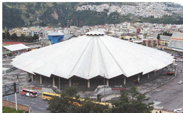
Slika 4. Coliseo General Rumiñahui , Quito, Ekvador

Među mnogim različitim primjenama mrežastoga sustava pokrivenog aluminijskim pokrovom mogu se spomenuti: krov sportske dvorane Coliseo General Rumiñahui , Quito, Ekvador, slika 4., i spomen-piramida u La Baie (Quebec, Kanada), slika 5., za sjećanje na štetu zbog poplave u 80-ima.