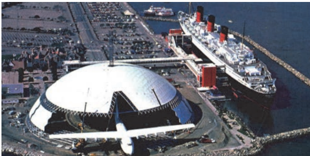
Slika 6. Kupola Spruce Goose , Long Beach, Kalifornija, USA

(sportskih dvorana, izložbenih centara, kongresnih dvorana, predavaonica, itd.). Ove primjene su vrlo zanimljive zbog brzine montaže, sustava spajanja i zavidnih dimenzija. Prve primjene su: Dome of Discovery izgrađena u Londonu za izložbu South Bank tijekom Festival of Britain (1951.), a sastoji se od prostornih mrežastih lukova s promjerom od 110 m i težinom od 24 kg/m 2 i geodetska kupola izgrađena za natkrivanje "Palasport" u Parizu, koristeći Kaiser Aluminium sustav s promjerom od 61 m i visinom od 20 m (1959.). Obje konstrukcije bile su poput prototipova u njihovom području: najveće i prve.