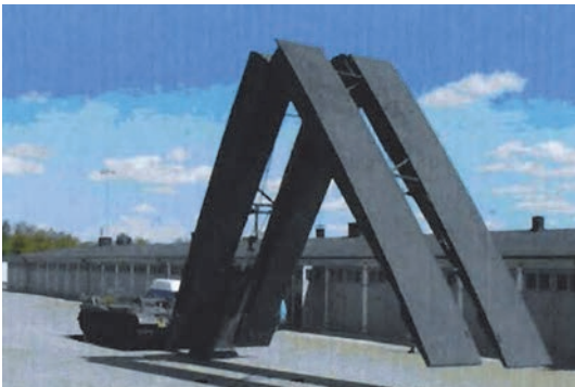
Slika 12. Novi švedski vojni most

Novo značajno područje primjene su vojni mostovi kod kojih mala težina i otpornost na koroziju imaju najvažniju ulogu. Zasad je poznato da se raspon do 40 m može svladati primjenom montažnih elemenata - jednostavno ih je transportirati i sklopiti. Glavna primjena ostvarena je u Velikoj Britaniji, Njemačkoj i Švedskoj, slika 12. U Njemačkoj se vojni most proizvodi sastavljen od montažnih jedinica, lagan za transport i postavljanje/sklapanje (slika 13.).