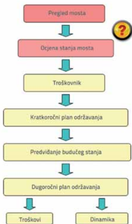
Slika 1. Pojednostavljena shema procesa planiranja izvanrednog održavanja mostova

Procesi koji ugrožavaju mostove uglavnom započinju bez vidljivih znakova, a tek u odmakloj fazi očituju se pojavama vidljivim na površini građevine. Zadatak inženjera pri pregledu je vidjeti, zabilježiti i prepoznati pojave koje su bitne za ocjenu stanja konstrukcije i opreme mosta, odnosno indikacije ili manifestacije procesa koji vode oštećenju. Interpretacijom viđenog i zabilježenog, elementima mosta dodjeljuju se ocjene stanja, koje se potom ugrađuju u jedinstvenu ocjenu čitave građevine. Određivanjem prioriteta i predviđanjem budućeg tijeka dotrajavanja planiraju se radovi, odnosno troškovi budućeg održavanja mostova (slika 1.).