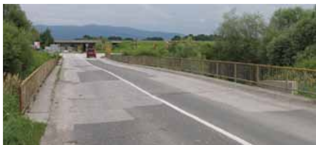
Slika 5. Prometna površina i ograde (Most 1)

Mod je oblik kvalitativnog ili kvantitativnog obilježja koji se najčešće pojavljuje, odnosno oblik obilježja s najvećim brojem ponavljanja, odnosno frekvencijom. Kod nominalnih obilježja mod se određuje brojenjem. Za ocjene oštećenja s frekvencijom ponavljanja moda natpolovične većine od 15 ispitanika ( f \geq 8 ) evidentirana je podudarnost u 62% od ukupnog broja ocijenjenih elemenata. S obzirom na neparan uzorak ispitanika, ako smanjimo granicu frekvencije ponavljanja moda na ( f \geq 7 ), evidentirana podudarnost od ukupnog broja ocijenjenih elemenata iznosi zadovoljavajućih 75 %. Slaganje ispitivača osobito je izraženo oko vidljivih manifestacija većih oštećenja