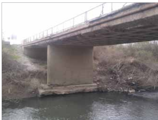
Slika 4. Upornjaci i stupovi (Most 1) u vrijeme pregleda, s vidljivim znakovima podlokavanja

ocjena u grupi ima vrijednost veću od medijana, a polovina ocjena u grupi ima vrijednost manju od medijana. Prema podacima je očito da za grupu ocjena oštećenja prema medijanu 4 i 5 koja predstavljaju znatna oštećenja elemenata, odnosno njihovu potpunu neupotrebljivost, raspodjela rezultata prema standardnoj devijaciji zadovoljava uvjet \sigma < 1,0 . To znači da je polovina oštećenja koja predstavljaju znatnu opasnost za konstrukciju ocijenjena u granicama vrijednosti stupnja oštećenja za jednu višu/nižu razinu ocjene. Ovaj podatak predstavlja zadovoljavajuću točnost za vizualno opažanje koje je kategorijski u ovom istraživanju podijeljeno ocjenama u pet razina.