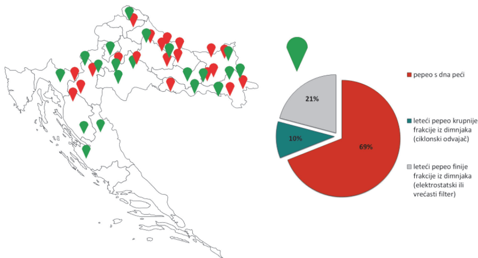
Slika 1. Lokacije aktivnih postrojenja na biomasi u Republici Hrvatskoj te udjeli različitih vrsta PDB-ova koji se generiraju u 22 postrojenja na biomasi

Ovo istraživanje daje pregled mehaničkih svojstava i svojstava trajnosti ispitanih na mješavinama lijevanog betona s PDB-om kao djelomičnom zamjenom sitnog agregata (pijeska), budući da njegova upotreba u betonu nije dovoljno proučavana. Cilj je pronaći mogućnosti primjene PDB-a u proizvodnji predgotovljenih elemenata. Za potrebe ovog istraživanja prikupljeni su različiti PDB-ovi iz 3 energane na području RH.