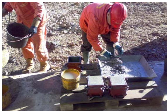
Slika 2. Uzimanje uzoraka za ispitivanje tlačne čvrstoće