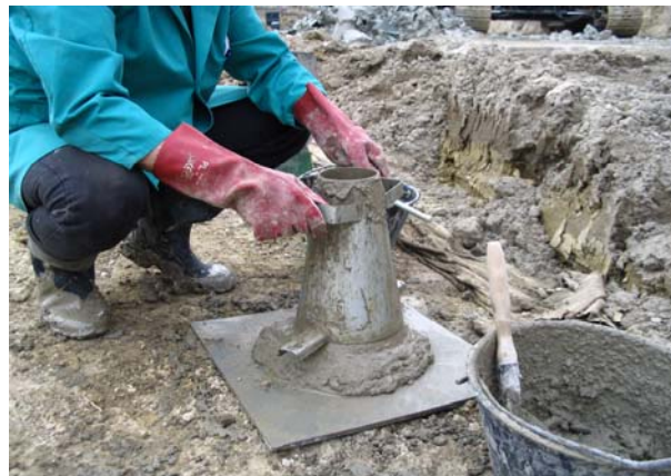
Slika 1. Ispitivanje svježeg betona metodom slijeganja