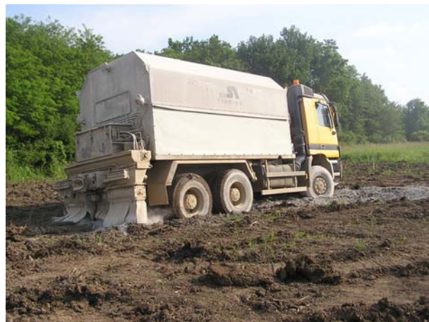
Slika 1. Cisterna za razastiranje cementa s dozatorom

Sloj od cementom stabiliziranoga zemljanog materijala uz dodatak GeoCreta na probnom polju na dionici državne ceste D-41 Vrbovec – Gradec ugrađivalo je poduzeće STRABAG d.o.o. postupkom miješanja na licu mjesta ( mix in place ) primjenom za takvu tehnologiju predviđene mehanizacije.