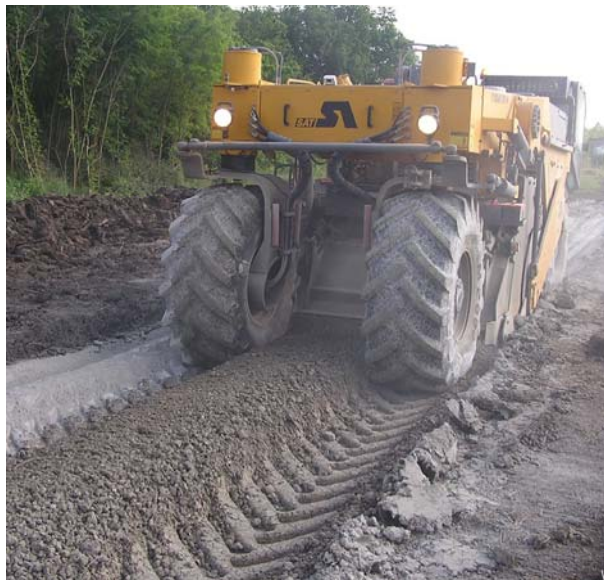
Slika 2. Miješalica Wirtgen – recycler WR 2000

nog tla i cementa upotrijebljena miješalica Wirtgen – recycler WR 2000. Količinu doziranja pojedinih komponenta mješavine na licu mjesta odredio je naručitelj bez prethodno laboratorijski dobivenog radnog sastava.