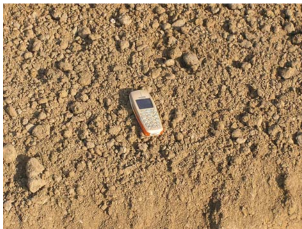
Slika 3. Izgled mješavine prirodnog tla, cementa i GeoCreta, nakon miješanja

Umješavanju ostalih komponentata u zemljani materijal prethodilo je skidanje gornjeg sloja zemljanog materijala u debljini od dvadesetak centimetara. Prema navodima naručitelja ispitivanja, na navedenu površinu jednolično je razastrto 200 kg GeoCreta, dok je cement CEM II/B (V-LL) 32,5 R, proizvođača Holcim d.o.o., doziran u količini od 60 kg/m 2 . Miješanje je provedeno u dubini od 30 cm. Umješavanje dodane mješavine cementa i GeoCreta provedeno je bez dodatnog doziranja vode uz broj prijelaza potreban da se grude zemljanog materijala potpuno usitne.