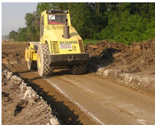
Slika 4. Zbijanje statičkim valjkom

Sloj je zbijen valjanjem statičkim valjkom i njegovan površinskim vlaženjem vodom.