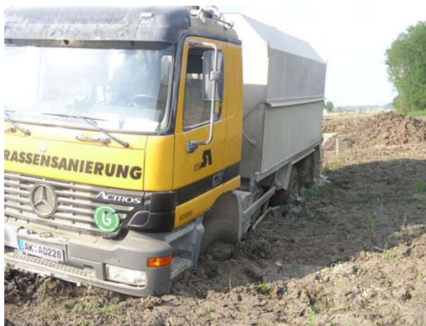
Slika 5. Nosivost tla na probnom polju

Terenskim je ispitivanjem bilo predviđeno ispitivanje modula stišljivosti metodom kružne ploče prema hrvatskoj normi HRN U.B1.046. Prije dodatka mješavine cementa i GeoCreta ispitivanje modula stišljivosti metodom kružne ploče nije dalo mjerljive rezultate. Slika 1. zorno prikazuje nosivosti prirodnog tla probnog polja.