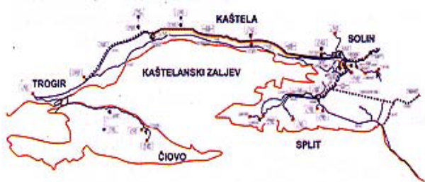
Slika 2. Vodoopskrbni sustav Split-Solin-Kaštela-Trogir

Postojeći vodoopskrbni sustav za područje gradova Splita, Solina, Kaštela i Trogira bazira se na zahvatu vode na izvoru rijeke Jadro u Solinu i dovođenju vode do mjesta potrošnje putem gravitacijskih kanala i u smjeru Splita i za smjer Solin – Kaštela – Trogir.