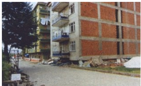
Slika 8. Oštećenje zgrade zbog mekog prizemlja http://www.its.caltech.edu/~ayhan/EQ/Golcuk.html

U središtu potresom pogođenih gradova, posebno u trgovačkim ulicama, veliki broj zgrada srušio se prema ulici, zbog popuštanja stupova prizemlja s ulične strane. Kao i u mnogim hrvatskim gradovima, ulična strana prizemlja pretvorena je u izlog, dok je s unutarnje strane zgrade, kao i na višim katovima, zadržano teško žiđe. Efekt je najčešće bio pojačan i rasporedom pregradnih zidova u smjeru okomito na ulicu. Time je uvedena nesimetrija u raspodjeli krutosti po tlocrtu i visini objekta. Relativni katni pomaci bili su preveliki (P- \Delta efekt) i to je najčešće rezultiralo rušenjem konstrukcije. Pojava mekih katova je bila naročito naglašena kod objekata sa višim prizemljem. Nedostatak armiranobetonskih posmičnih zidova ubrzao je konstruktivne i nekonstruktivne štete nastajanjem plastičnih zglobova na krajevima stupova. Primjer rušenja zbog drobljenja mekog prizemlja prikazuje slika 8.