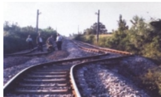
Slika 3. Željeznička pruga prekinuta rasjedom otvorenim u potresu Kocaeli

http://www.itu.edu.tr/deprem/rapor/deprem.html