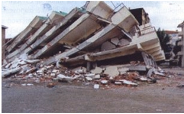
Slika 9. Primjer rušenja kuće s mekim katovima http://www.its.caltech.edu/~avhan/EQ/Golcuk.html

Iako se meko prizemlje ponekad izvodilo namjerno, zato da bi se energija unesena potresom potrošila u gibanju objekta, jednom kad je granično opterećenje dosegnuto, dolazi do plastificiranja zglobova u stupovima, nosivi se sustav pretvara u mehanizam i objekt se ruši. Posebno tome pridonose nesimetrije u tlocrtu, tj. udaljenost središta krutosti od središta masa koje pojačavaju torzijsko djelovanje potresnih opterećenja i povećavaju opterećenje na mekše elemente. Pojavu popuštanja vertikalnih elemenata svih katova dobro ilustrira slika 9.