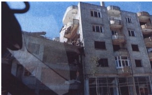
Slika 10. Oštećenje zgrade s nedovoljno širokom potresnom razdjelnicom

Sudaranje susjednih građevina događa se tijekom potresa ako seizmička razdjelnica nije dovoljno široka ili čak uopće nije izvedena. Nepovoljniji slučaj nastaje kada visine katova susjednih objekata nisu jednake, što rezultira u sudaranju po visini stupa. Iako turski propisi reguliraju širinu razdjelnice na 3-5 cm, u stvarnosti to najčešće nije primijenjeno. Primijećeno je dosta oštećenja uzrokovanih ovim efektom (slika 10.).