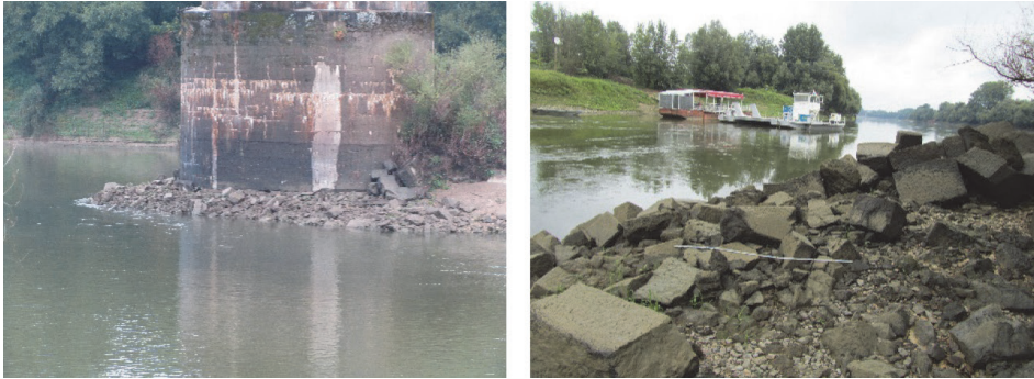
Slika 2. Riprap zaštita od podlokavanja savskog mosta u Jasenovcu, pogled nizvodno prema stupu (lijevo) i detalj iste lokacije (desno)

cjenu dubine podlokavanja oko nezaštićenih stupova i kao rezultat se izvodila zaštita od podlokavanja, od kojih je jedna od najraširenijih metoda riprap zaštita [11]. Istraživanje urušavanja riprap zaštite u kavernu i povezane opasnosti za stabilnost i sigurnost mosta rijetko su istraživane, uključujući riprap u obliku kakav se tradicionalno primjenjuje u Hrvatskoj [15].