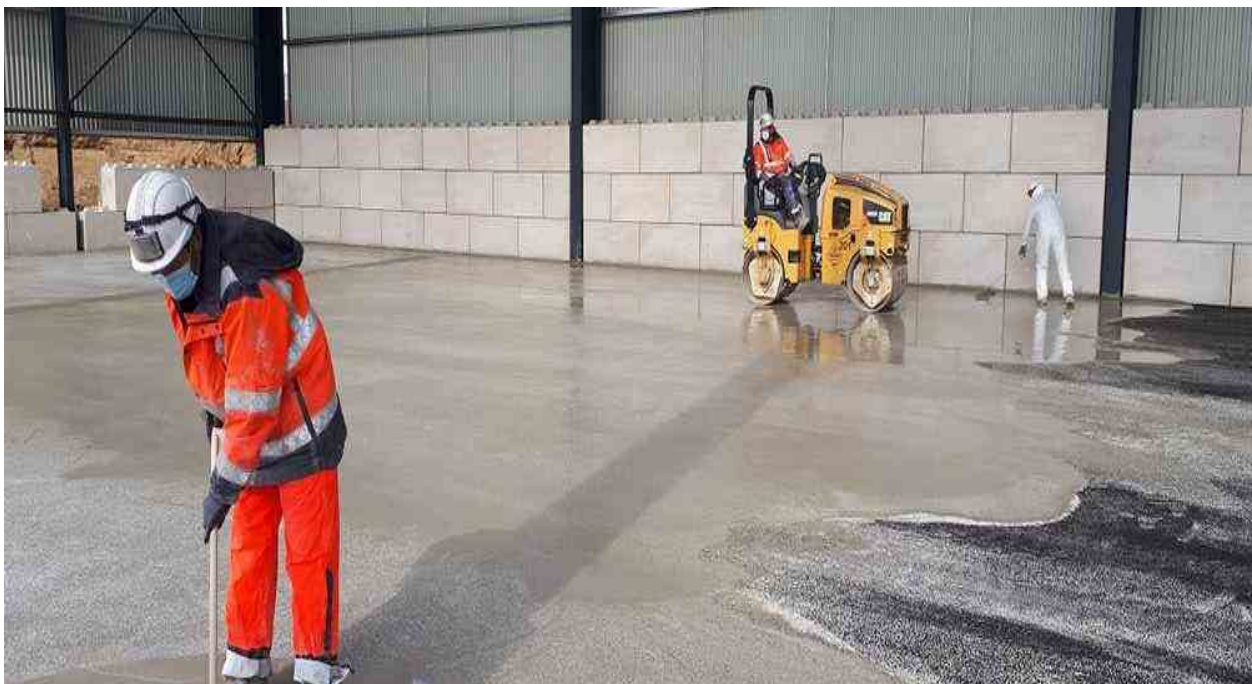
Slika 8. Uklanjanje viška cementnog gela