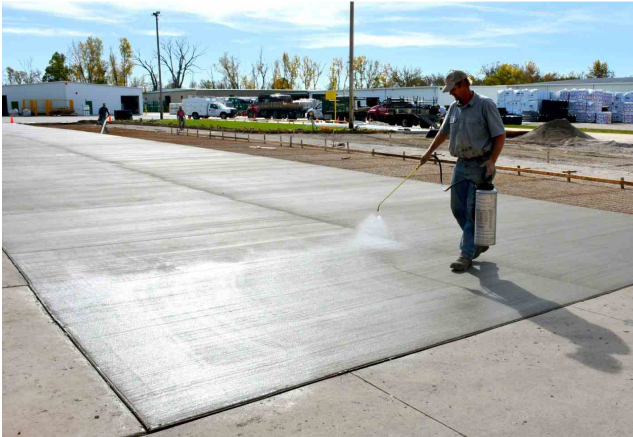
Slika 9. Nanošenje kemijskog sredstva za njegu ( https://theconstructor.org/concrete/concrete-curing-compound-types/13478/ )

Na površinu mokrog, gelom ispunjenog poroznog asfalta nanosi se kemijsko sredstvo za njegu kako bi se izvedeni sloj zaštitio od prijevremenog sušenja. Kemijska sredstva trebaju biti svijetle boje, tako da ne apsorbiraju sunčanu toplinu već reflektiraju sunčeve zrake i tako smanjuju temperaturu kolnika tijekom razdoblja njege. Kemijska sredstva za njegu treba fino raspršiti i jednoliko nanijeti na površinu, a obično se nanose pomoću tlačne, ručne pumpe (Slika 9) [4].