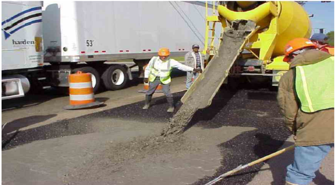
Slika 6. Izlijevanje cementnog gela na površinu [5]

Ukoliko cementni gel zadovoljava tražene zahtjeve viskoznosti, izlijeva se na površinu poroznog asfalta (Slika 6). Cementni gel se nanosi sve dok površina nije u potpunost zasićena. Ugrađivanje se provodi u širokim trakama (3 do 6 m) koje su odvojene drvenom letvom. Ovakav način nanošenja cementnog gela sprječava prelijevanje na prethodne površine [2].