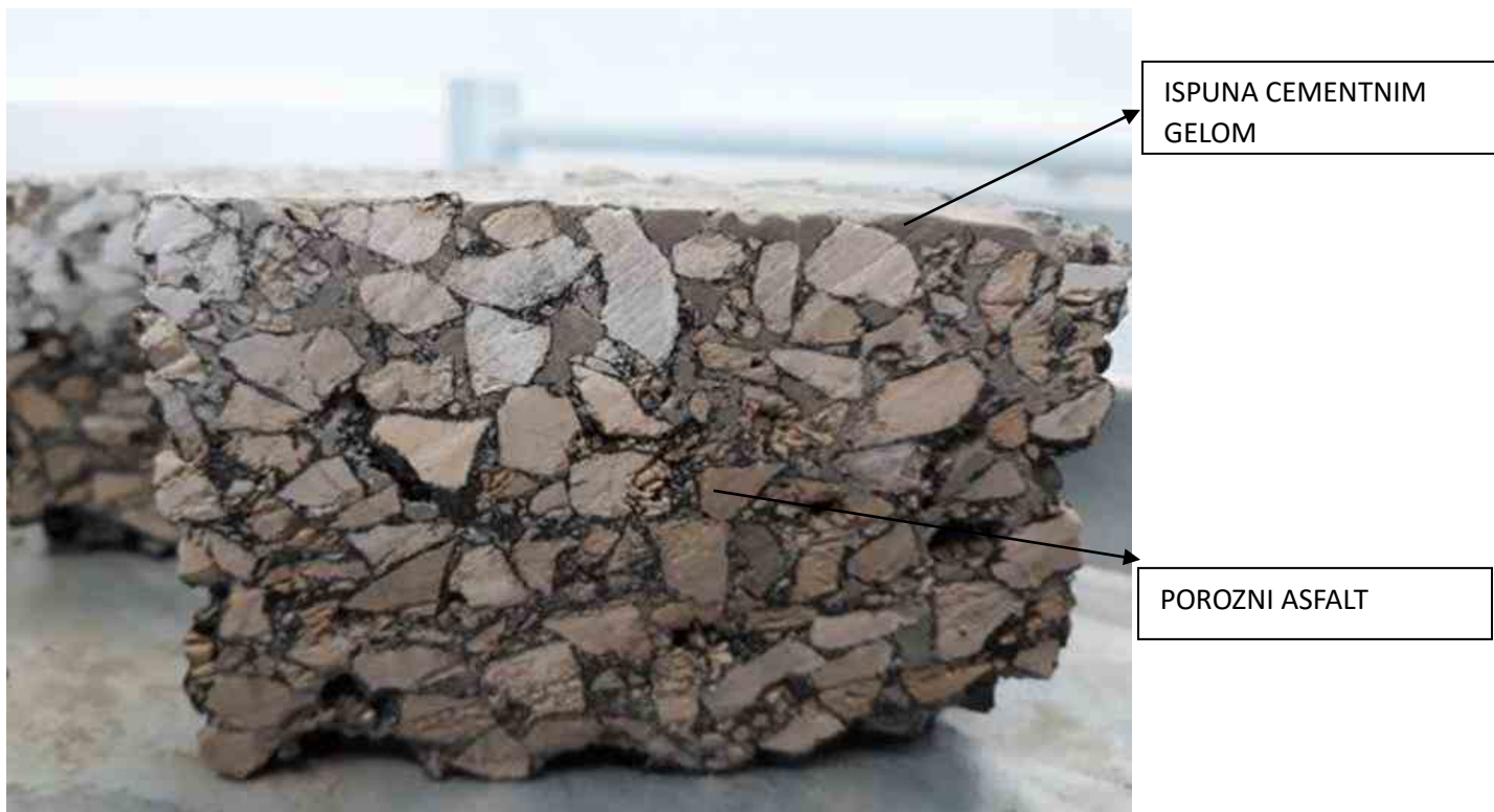
Slika 1. Presjek poroznog asfalta ispunjenog cementnim gelom [5]

Habajući sloj kompozitnog kolnika sastoji se od poroznog asfalta kao kostura i cementnog gela kao njegove ispune, pa stoga njegova svojstva ovise o obje komponente. Presjek poroznog asfalta ispunjenog cementnim gelom prikazan je na Slici 1. Porozni asfalt i cementni gel zajedno tvore monolitan spoj koji istovremeno posjeduje svojstva bitumenskih mješavina (elastičnost) i svojstva hidrauličkim vezivom vezanih materijala (mehaničku otpornost, otpornost na kemijske utjecaje, svijetlu boju itd). U nastavku će se detaljnije prikazati karakteristike sastavnih materijala kompozitnog kolnika.