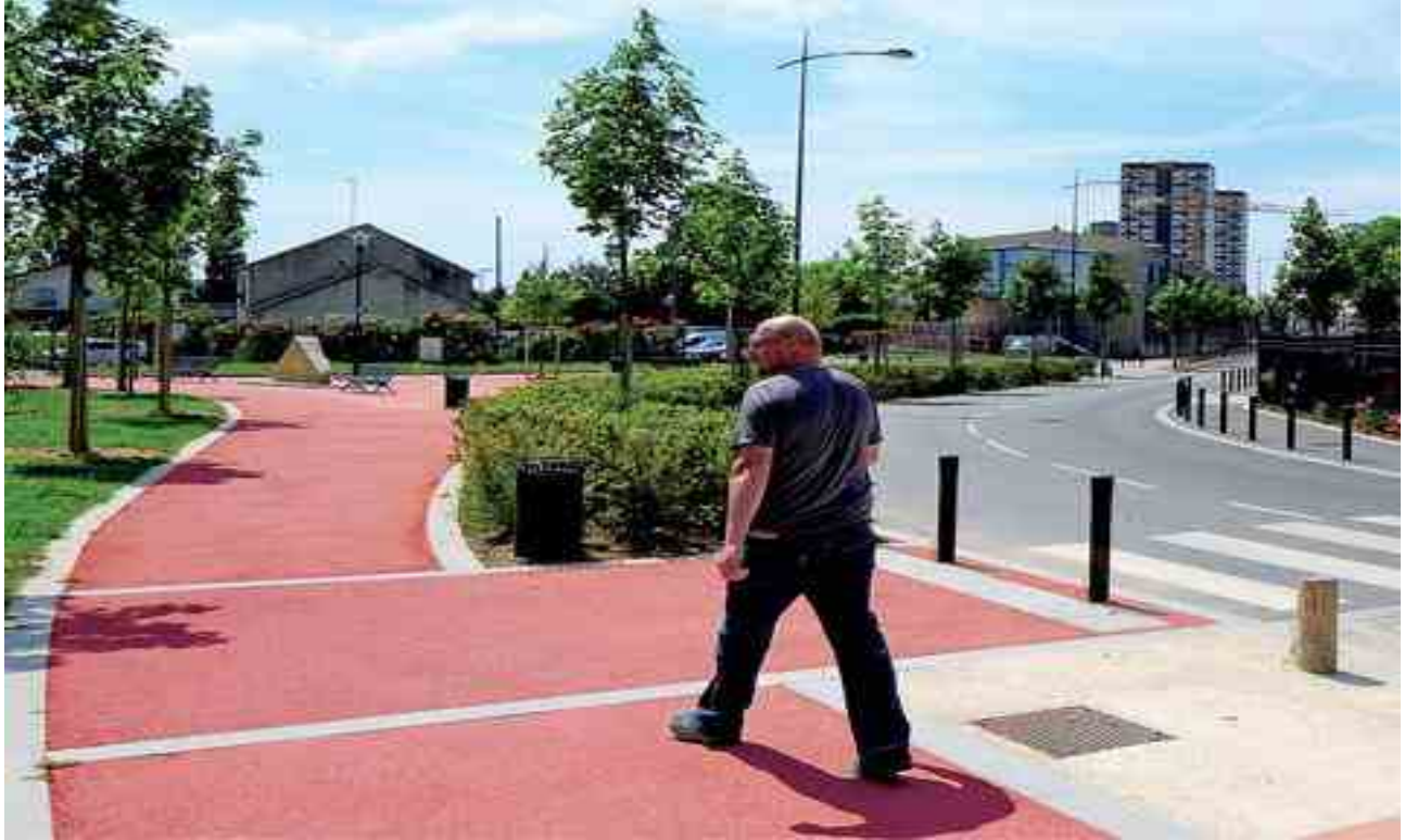
Slika 3. Porozni asfalt ispunjen cementnim gelom s crvenim pigmentom ( https://www.tegra.hr/proizvodi-i-usluge/asfalt-ispunjen-cem-gelom/a45 )

Punilo spada u grupu mineralnih dodataka i njima se smatraju sve sitne čestice koje prolaze kroz otvor sita 0,063 mm kao što su vapno, leteći pepeo i sl. Može biti prirodno prisutno u agregatu ili posebno proizvedeno i dodano u agregat.