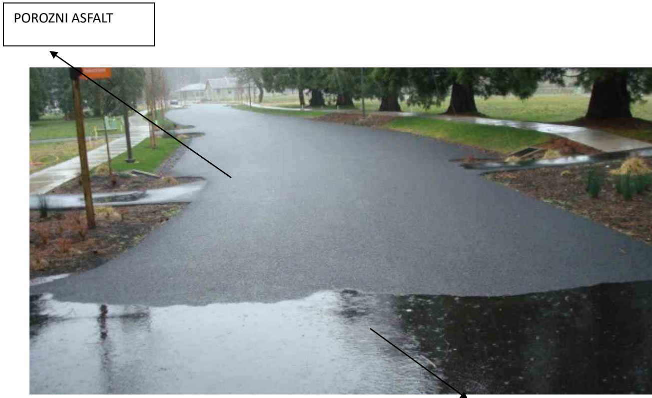
Slika 2. Razlika između poroznog asfalta i asfaltbetona ( https://m-kvadrat.ba/razlicite-vrste-asfaltnih-trotoara-u-konstrukciji/ )

udjela šupljina rezultira smanjenjem stabilnosti i povećanjem tečenja po Marshallu. Smanjenje stabilnosti i povećanje vrijednosti tečenja po Marshallu posljedica je smanjenja gustoće s povećanjem poroznosti [1].