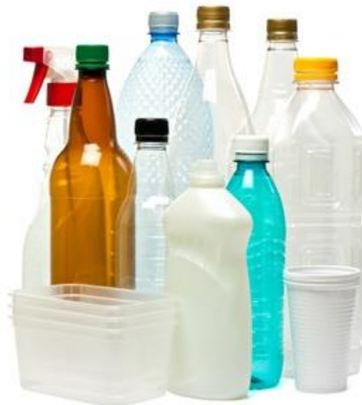
Slika 1. Spektar korištenja plastike u svakodnevnom životu

Zbog nepravilnog zbrinjavanja velika količina plastičnog otpada svake godine dospije u okoliš izazivajući brojne zabrinutosti o njegovom utjecaju na kvalitetu prirodnih resursa i zdravlje ekosustava [2]. Plastika je važan materijal u današnjem svijetu s obzirom na izvanredna fizikalna i kemijska svojstva, inertnost, široku uporabljivost i mogućnost ponovne upotrebe. Shvaćajući potencijal plastike, njezina je proizvodnja na globalnoj razini porasla s 1,5 milijuna tona 1950. - na 359 milijuna tona 2018. godine.