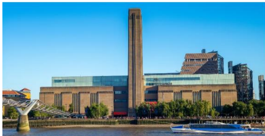
Slika 7. Galerija danas

Isto tako, osim prenamjene same zgrade, prostor oko zgrade također je prenamijenjen te se danas koristi kao prostor za odmor i druženje posjetitelja galerije, ali vrlo je važan jer povezuje grad i galeriju. Sa sve četiri strane oko