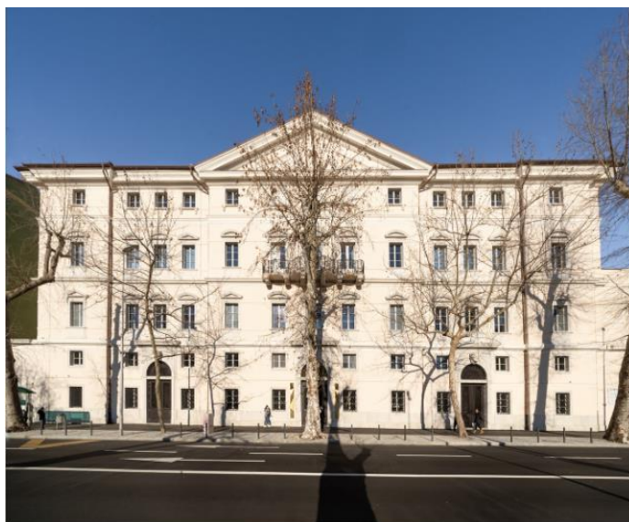
Slika 12. Muzej grada Rijeke

Kompleks nekadašnje Šećerane koja je ugašena ostao je bez funkcije krajem devedesetih godina. U jednom od kompleksa palače Šećerane otvoren je Muzej moderne i suvremene umjetnosti, a 2020. godine u najvećoj zgradi odnosno palači Šećerani uselio je Muzej grada Rijeke. Još je nekoliko uspješnih primjera iskorištavanja industrijske, ali i kulturne baštine koje možemo vidjeti u gradu Rijeci.