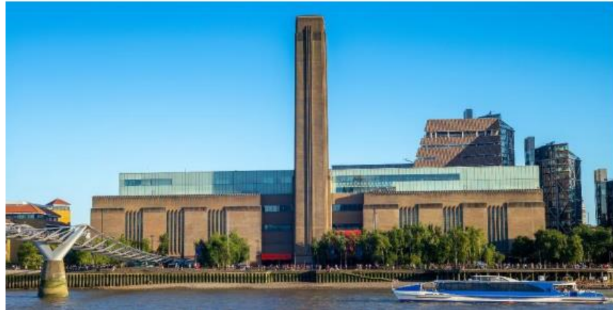
Slika 7. Galerija danas

Isto tako, osim prenamjene same zgrade, prostor oko zgrade također je prenamijenjen te se danas koristi kao prostor za odmor i druženje posjetitelja galerije, ali vrlo je važan jer povezuje grad i galeriju. Sa sve četiri strane oko