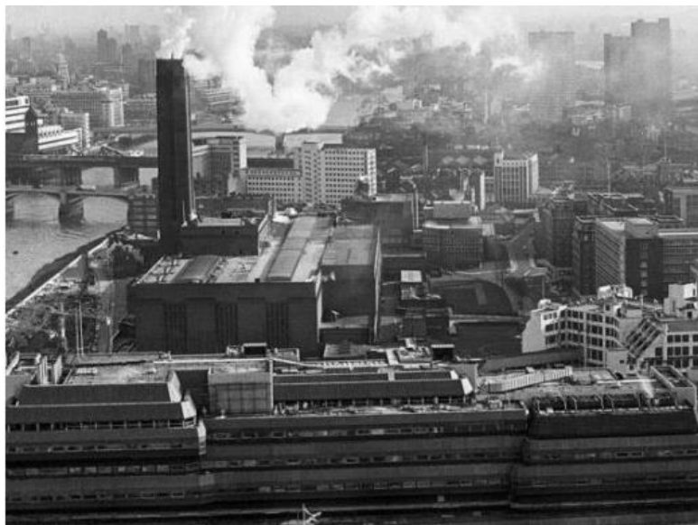
Slika 6. Hidroelektrana Bankside , 1979.

1996. godine počelo je planiranje projekta prenamjene elektrane i započeti su radovi pa je tako nekadašnja turbinska prostorija postala ulazni izlazni dio, a nekadašnja kotlovnica postala je galerija muzeja. Od 2000. godine zgrada bivše elektrane služi za smještaj muzeja i galerije Tate Modern Art te je jedan od najpoznatijih muzeja i galerija u cijelom Londonu.