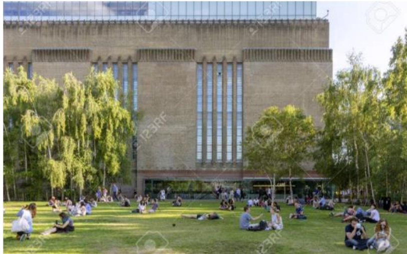
Slika 8. Zapadni park Tate Modern

galerije napravljeni su parkovi sa raznim sadžajima te na tom prostoru dominira drveće i travnjaci koji služe kao mjesto za odmor.