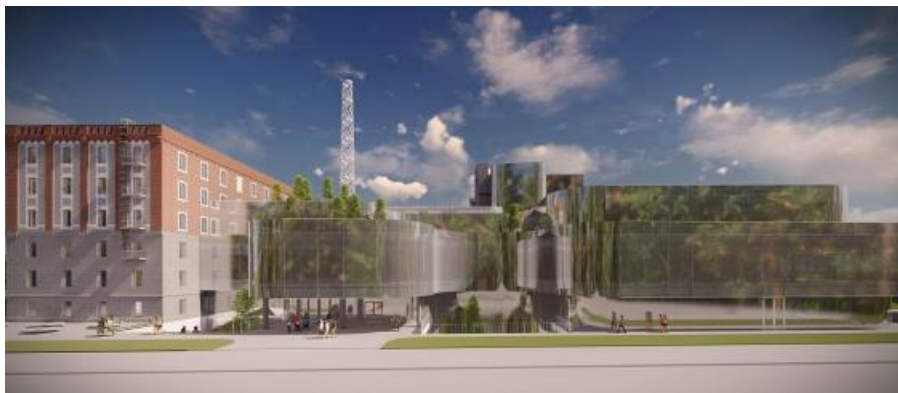
Slika 10. 3D prikaz budućeg izgleda knjižnice

Površina izgradnje trebala bi obuhvaćati prostore javne namjene, uredske prostore, prostore za knjige i brojne druge prostore.