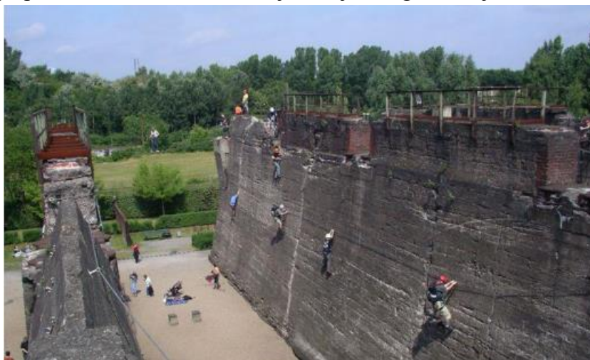
Slika 2. Park za penjanje

Park je smješten u sjevernom dijelu grada Duisburga. Na ovom prostoru nekad se nalazila čeličana koja je bila najveći proizvođač čelika u Njemačkoj te je zatvorena 1985. godine. Ideja je bila očuvati čeličanu zbog arhitektonske vrijednosti što je na kraju i ostvareno i čeličana je očuvana kao industrijski spomenik, a cijeli kompleks sastavljen je od više dijelova od kojih svaki ima drugačiju funkciju. Tako je na betonskim zidovima nekadašnjeg bunkera napravljen park za penjanje, nekadašnji plinski spremnik napunjen je vodom te je postao ronilački centar, a u prostoru gdje se nekad nalazila visoka peć redovito se održavaju kazališne predstave. Nekadašnje željezničke tračnice danas su pješačke zone, a također otvoreni su i prostori s brojnim kulturnim i sportsko- rekreacijskim sadržajima. U sklopu parka nalaze se i restorani i još brojni drugi sadržaji za turiste.