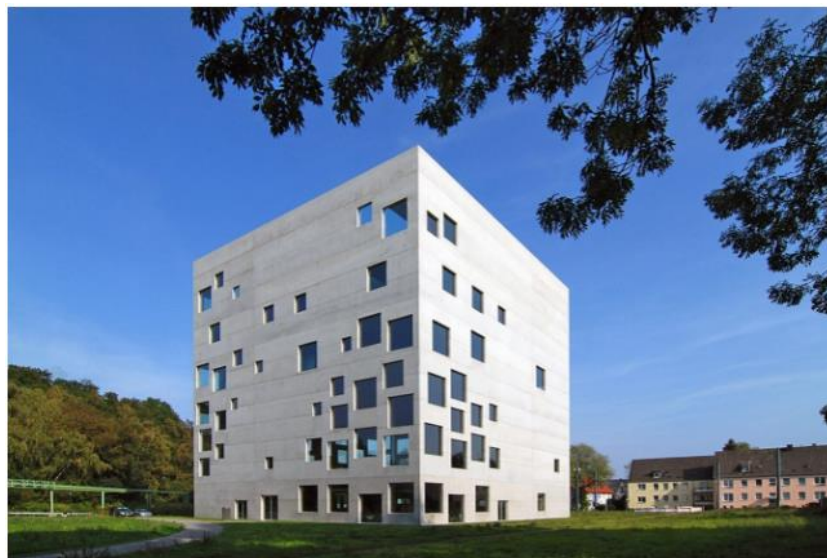
Slika 5. „Zollverein škola za menadžment“