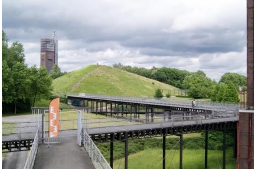
Slika 3. Nordsternpark

objekti nekadašnjeg kamenoloma dominiraju te se prema njima orijentiraju i ostali objekti za rekreaciju, stanovanje i dr.