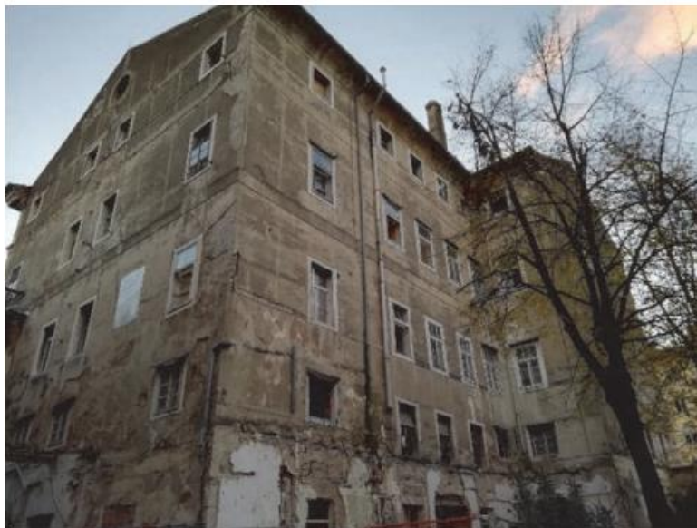
Slika 11. Pročelje Palače Šećerane prije obnove

Kompleks nekadašnje Šećerane koja je ugašena ostao je bez funkcije krajem devedesetih godina. U jednom od kompleksa palače Šećerane otvoren je Muzej moderne i suvremene umjetnosti, a 2020. godine u najvećoj zgradi odnosno palači Šećerani uselio je Muzej grada Rijeke. Još je nekoliko uspješnih primjera iskorištavanja industrijske, ali i kulturne baštine koje možemo vidjeti u gradu Rijeci.