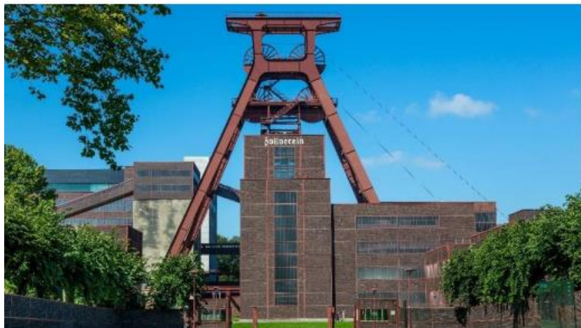
Slika 4. Bivša tvornica Zollverein