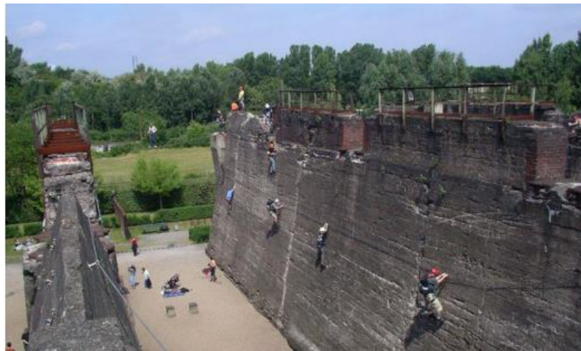
Slika 2. Park za penjanje

Park je smješten u sjevernom dijelu grada Duisburga. Na ovom prostoru nekad se nalazila čeličana koja je bila najveći proizvođač čelika u Njemačkoj te je zatvorena 1985. godine. Ideja je bila očuvati čeličanu zbog arhitektonske vrijednosti što je na kraju i ostvareno i čeličana je očuvana kao industrijski spomenik, a cijeli kompleks sastavljen je od više dijelova od kojih svaki ima drugačiju funkciju. Tako je na betonskim zidovima nekadašnjeg bunkera napravljen park za penjanje, nekadašnji plinski spremnik napunjen je vodom te je postao ronilački centar, a u prostoru gdje se nekad nalazila visoka peć redovito se održavaju kazališne predstave. Nekadašnje željezničke tračnice danas su pješačke zone, a također otvoreni su i prostori s brojnim kulturnim i sportsko- rekreacijskim sadržajima. U sklopu parka nalaze se i restorani i još brojni drugi sadržaji za turiste.