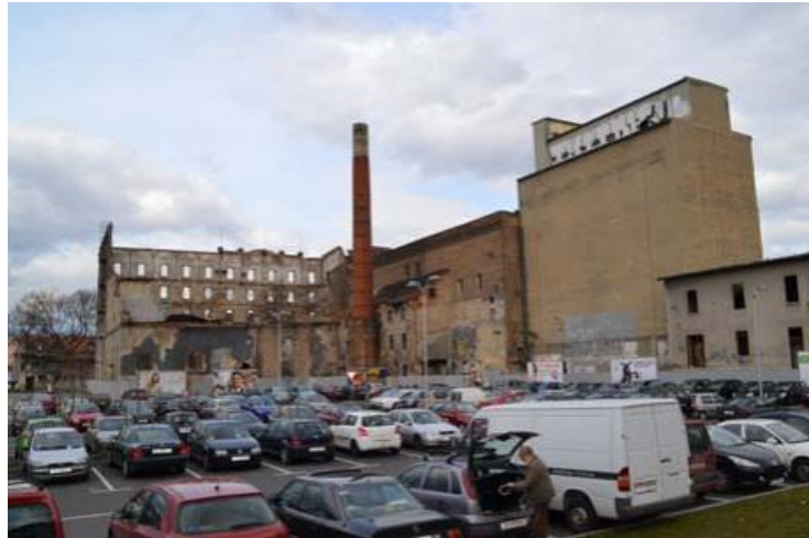
Slika 9. Stanje Paromlina 2013. godine

Tijekom kasnijih godina cijeli kompleks je nadograđivan i preuređivan, a zadesila su ga čak tri požara. Požar koji je izbio 1925. godine u kojemu je stradalo skladište i požar 1988. doveli su u pitanje sigurnost kompleksa. Paromlin je u funkciji kao industrijska građevina biosve do 80-ih godina 20. stoljeća kada se javlja ideja o njegovoj prenamjeni i želji za drugim sadržajima koji bi se uklopili s njegovom lokacijom koja je danas u samom središtu grada. 1980. godine doneseno je Rješenje Regionalnog zavoda o zaštiti Paromlina kao spomenika industrijske baštine.