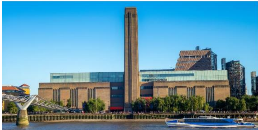
Slika 7. Galerija danas

Isto tako, osim prenamjene same zgrade, prostor oko zgrade također je prenamijenjen te se danas koristi kao prostor za odmor i druženje posjetitelja galerije, ali vrlo je važan jer povezuje grad i galeriju. Sa sve četiri strane oko