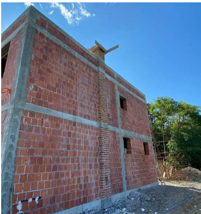
Slika 30. Prikaz dimnjaka

Dimnjak je element koji se koristi za odvođenje dima vatre iz peći u prostoriji koja se grije. Dimnjak je ozidan punom opečnom ciglom povezanom produžnim mortom. Dno dimnjaka nalazi se u prizemlju, u dnevnom boravku, a vrh mu je na visini iznad završnog serklaža atike (slika 30.).