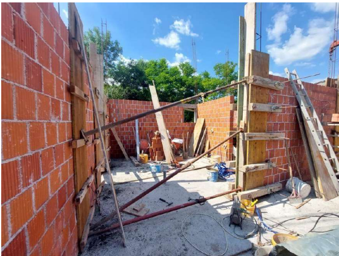
Slika 11. Postavljena oplata vertikalnih serklaža

Oplata horizontalnog serklaža postavlja se jednostrano na svim rubovima zgrade. Sastoji se od drvene oplata („table za šalovanje“), vijaka koji se ubušuju kroz zidove i pomoću zatezaljki učvršćuju i osiguravaju montažni sustav od pucanja ili popuštanja tijekom procesa betoniranja.