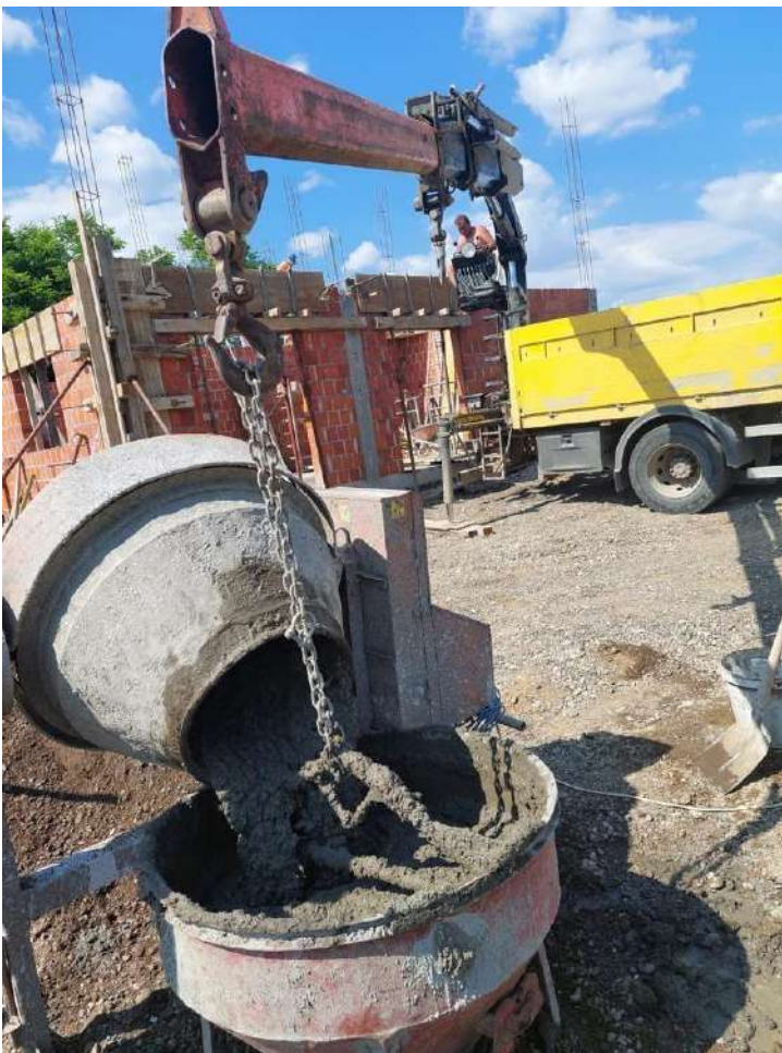
Slika 13. Betoniranje nadvoja nad staklenim stijenama

Nadvoji predstavljaju monolitni armiranobetonski konstruktivni element kojemu je osnovna zadaća spajanje zidanih elemenata nad većim otvorima. Armatura nadvoja sastavlja se od šipki armature 4 \times \varnothing 10 mm i vilica koje ih povezuju. Montaža oplata počinje postavljanjem vertikalnih pridržaća na koje se oslanja podnica nadvoja. Zatim se postavljaju oplatne ploče s bočnih strana i povezuju sustavom kravata i klinova između kojih se nalaze čelični žileti. Na taj način, gornja ploha nadvoja ostaje otvorena i kroz nju se ugrađuje i njeguje beton. Nadvoji se izvode u svrhu povećanja krutosti zidane konstrukcije nad otvorima kao što su vrata, prozori, staklene stijene i slično. Beton razreda C30/37 proizvodi se u miješalici na gradilištu, a način ugradnje ovisi o položaju nadvoja. Nadvoji nad vratima iznad kojih je izvedena ploča betoniraju se ručno, lopatom ili zidarskom žlicom, dok se za nadvoje prozora i staklenih stijena koristi kibla za beton na pogon kamiona sandučara. Nakon izvedenog nadvoja nad vratima, zida se dodatni red blok opekam u svrhu zatvaranja prostora. (Slika 13. – 15.)