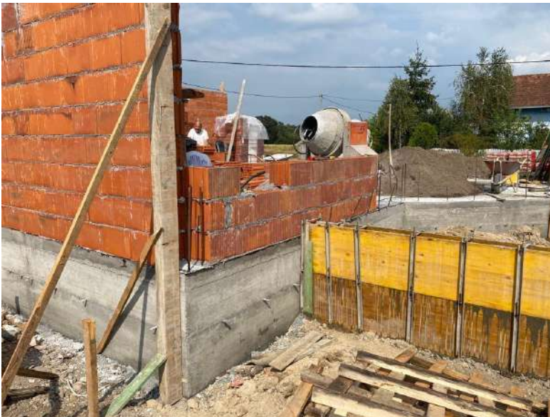
Slika 8. Zidanje nosivih zidova (prikaz s drugog gradilišta)

Svi zidovi prizemlja i prvog kata su zidani šupljom blok opekom, širine 25 ili 12 cm, u ovisnosti od njihove funkcije. Blok opeka dostavljena je na gradilište na drvenim paletama i postavljena na već izvedenu betonsku ploču. Produžni mort proizvodi se u miješalici na gradilištu, te se odma koristi i ugrađuje, a sastoji se od cementa, vapna, pijeska i vode. Produžni mort proizveden je u omjerima cement:vapno:pijesak = 1:3:9. Prije samog pristupanja zidanju, na betonsku ploču postavljena je hidroizolacija u svrhu zaštite ziđa od potencijalnog uzdizanja kapilarne vode i narušavanja trajnosti i nosivosti uslijed potencijalne pojave vlage. Zidovi su povezani vertikalnim i horizontalnim armiranobetonskim serklažima. Također, radi povećanja krutosti i nosivosti pregradnog ziđa ostvaruje se uklještenje zida u postojeći zid tako što se dio ugrađenog bloka odbije zidarskim čekićem i u taj prostor se postavlja novi blok i zapunjava mortom (Slika 8. i 9.).