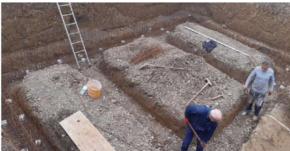
Slika 3. Građevna jama – ugradnja armature za temeljne trake

Priprema za izvođenje temeljnih traka počela je iskopom građevne jame dubine 2,4 m. Temeljne trake (Slika 3.) visine 50 cm i širine 60 cm izvedene su bez oplata s armaturnim mrežama Q-335 na dubini 2,4 m od postojećeg terena, formirajući tako armiranobetonsku temeljnu rešetku s vertikalno postavljenim armaturnim šipkama za naknadno ostvarivanje veze temelja sa stupovima i zidovima podruma. Razred tlačne čvrstoće betona za temelj je C30/37. U prostor između traka, odnosno u polja rešetke sipa se agregat veličine čestica > 5 mm (prirodni šljunak), te se dodatno zbija vibropločom zbog povećanja gustoće i čvrstoće sloja. Preko temeljne rešetke se ugrađuje sloj podložnog betona razreda C12/15 visine 5 cm. Na podložni beton se postavlja sustav hidroizolacije, iznad kojeg se izvodi temeljna ploča debljine 15 cm (C30/37), armirana u dvije zone (Slika 4.). Donja zona armature se sastoji od armaturnih mreža Q-335, a gornja zona od armaturnih mreža Q-188. Vezu i razmak zona omogućuje ugradnja „jahača“ nakon postavljanja donje zone.