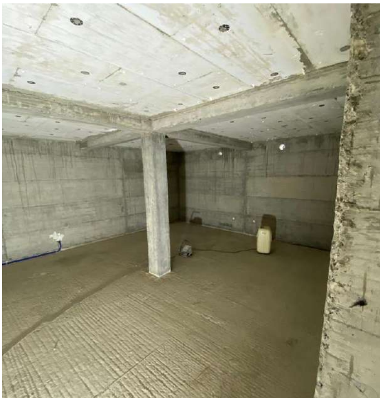
Slika 7. Izvedene grede i stropna ploča podruma

Stropna ploča podruma visine 15 cm i grede podruma visine 35 cm izvedene su monolitno, oslanjajući se na stupove i AB zidove podruma (Slika 7.). Armatura stropne ploče ista je kao i armatura temeljne ploče (armiranje u dvije zone), a armatura grede sastoji se od 6 šipki armature \varnothing 14 mm i vilica, te 2 dodatne „pridržavajuće“ šipke \varnothing 10 mm. Beton je razreda C30/37, a ugrađen je betonskom pumpom i betonom proizvedenim u tvornici betona. Beton je dostavljen kamionom mikserom na gradilište.