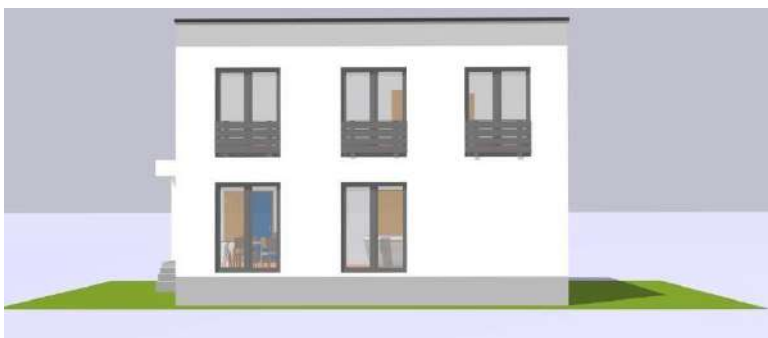
Slika 2. Planirani konačni izgled – pogled na pročelje