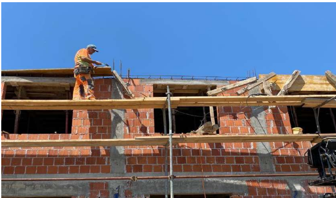
Slika 12. Montaža oplata horizontalnih serklaža

Oplata horizontalnog serklaža postavlja se jednostrano na svim rubovima zgrade. Sastoji se od drvene oplata („table za šalovanje“), vijaka koji se ubušuju kroz zidove i pomoću zatezaljki učvršćuju i osiguravaju montažni sustav od pucanja ili popuštanja tijekom procesa betoniranja.