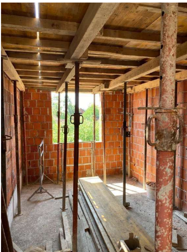
Slika 21. Kompletan oplatni sustav

Grede prizemlja su zbog estetskih razloga unutarnjeg prostora izvedene kao kontragrede, odnosno greda visine 45 cm koja se ne vidi s donje strane ploče, nego se njeno dno nalazi na istoj visini kao i donja površina stropne ploče. Na ovaj način se ostvaruju jednaka nosiva svojstva konstruktivnog elementa uz bolje estetske uvjete. Armatura kontragrede sastoji se od šipki 5 \times \varnothing 14 mm, 2 \times \varnothing 10 mm, te vilica \varnothing 8 mm. Kontragreda se izvodi nakon betoniranja ploče stropa prizemlja. (Slika 22.)