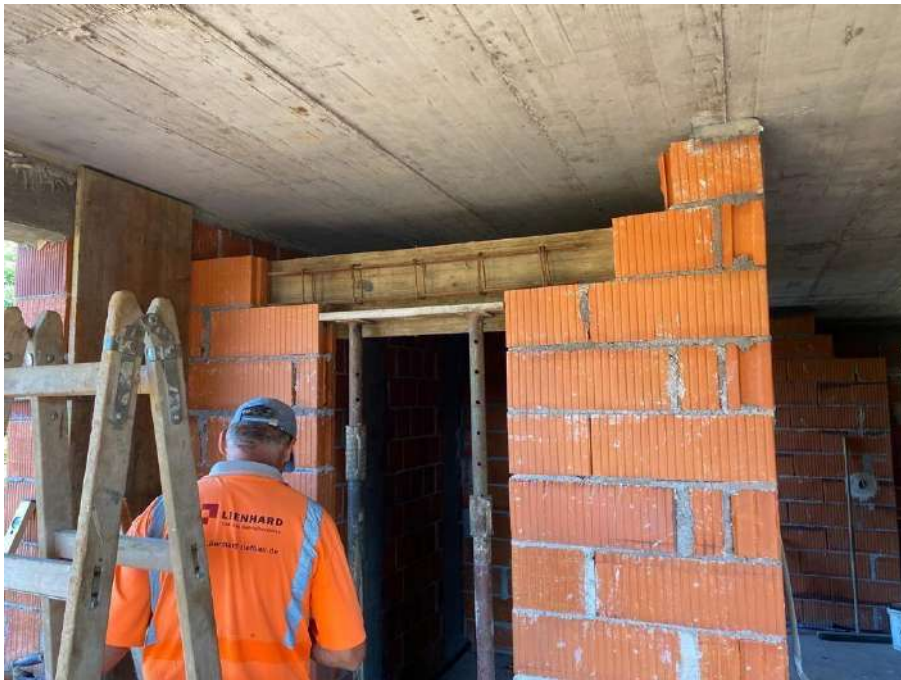
Slika 14. Postavljanje oplata nadvoja vrata