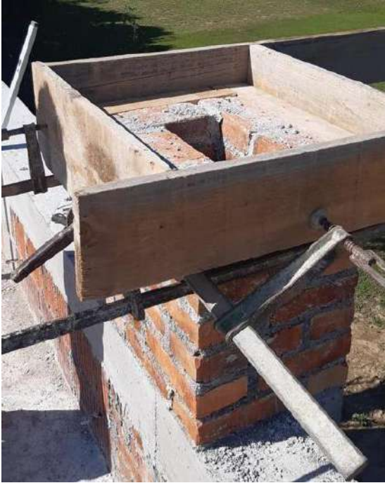
Slika 31. Oplata kape dimnjaka

Završna kapa dimnjaka (Slika 31.) izvedena je od armiranog betona i nalazi se na samom vrhu dimnjaka, a daje mu finalni izgled.