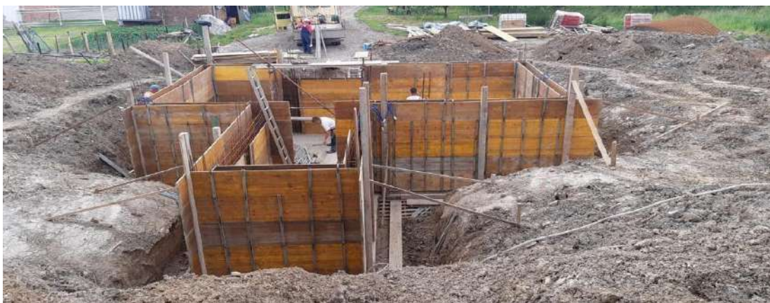
Slika 6. Postavljena armatura i oplata zidova podruma