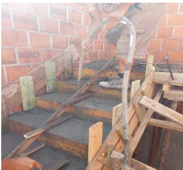
Slika 17. Betoniranje stepenica i vibriranje betona iglom

Stubište predstavlja prostor za kretanje između katova i ograničeno je zidovima sa strane. Stubište se izvodi od armiranog betona razreda tlačne čvrstoće C30/37. Armatura stubišta izrađuje se kombinacijom armaturnih šipki i mreža. Stubište se sastoji od donjeg i gornjeg kraka s podestom koji ih povezuje. Betonira se u dijelovima, najprije donji krak i podest, a zatim gornji krak. Beton se proizvodi na gradilištu u miješalici, a do mjesta ugradnje transportira se kamionom sandučarom. Oplatni sustav se oslanja na više drvenih rogova koji su postavljeni na vertikalne pridržače. (Slike 17. i 18.)