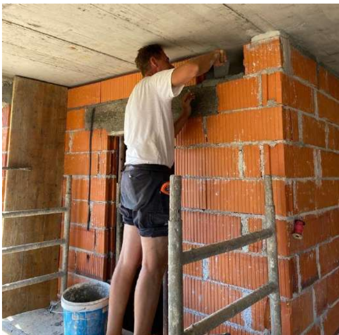
Slika 16. Zidanje iznad nadvoja