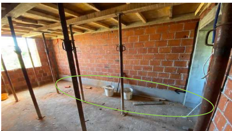
Slika 22. Izvedena kontragreda

Grede prizemlja su zbog estetskih razloga unutarnjeg prostora izvedene kao kontragrede, odnosno greda visine 45 cm koja se ne vidi s donje strane ploče, nego se njeno dno nalazi na istoj visini kao i donja površina stropne ploče. Na ovaj način se ostvaruju jednaka nosiva svojstva konstruktivnog elementa uz bolje estetske uvjete. Armatura kontragrede sastoji se od šipki 5 \times \varnothing 14 mm, 2 \times \varnothing 10 mm, te vilica \varnothing 8 mm. Kontragreda se izvodi nakon betoniranja ploče stropa prizemlja. (Slika 22.)