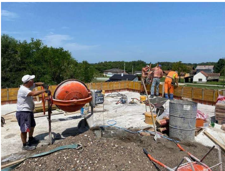
Slika 29. Betoniranje serklaža atike

Dimnjak je element koji se koristi za odvođenje dima vatre iz peći u prostoriji koja se grije. Dimnjak je ozidan punom opečnom ciglom povezanom produžnim mortom. Dno dimnjaka nalazi se u prizemlju, u dnevnom boravku, a vrh mu je na visini iznad završnog serklaža atike (slika 30.).