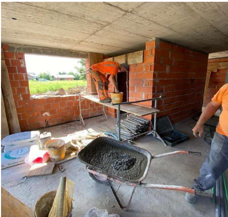
Slika 15. Ugradnja betona