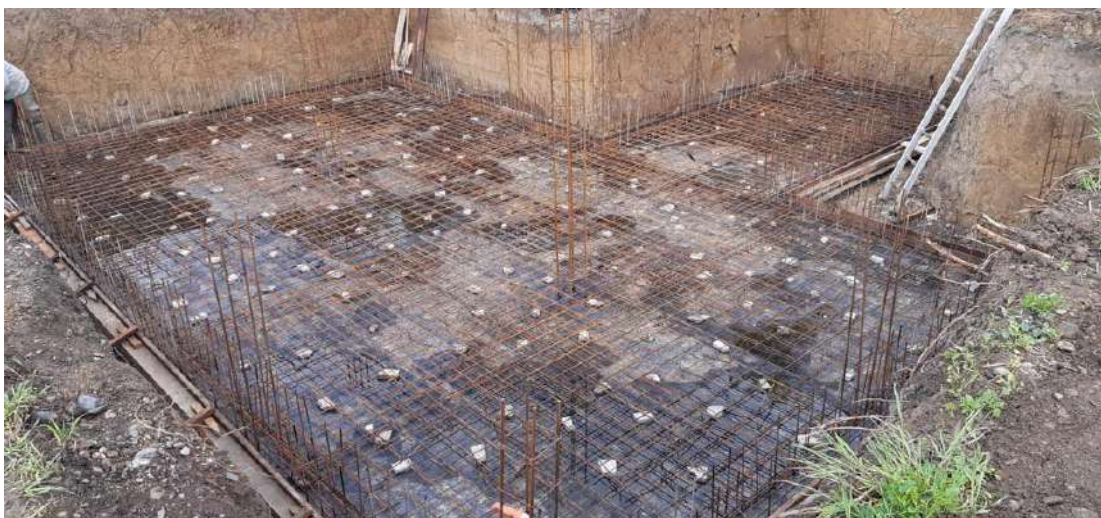
Slika 4. Hidroizolacija i postavljena armatura temeljne ploče

Zbog različitih visina podrumskih prostorija i prostorija prizemlja, dio temelja izveden je na različitoj dubini u odnosu na većinu temelja (82 cm od postojećeg terena). Viši dio temelja izveden je ubušivanjem armaturnih šipki u već izvedene zidove podruma, čime se ostvaruje ujedinjenje cijele temeljne konstrukcije (Slika 5.).