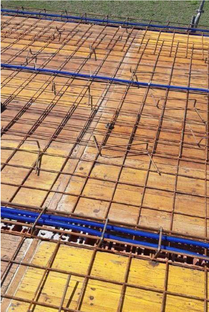
Slika 23. Detalj jahača i distancera

Armatura stropne ploče d=15 cm sastoji se od armaturnih mreža postavljenih u dvije zone. Donju zonu čine mreže Q-335, a gornju Q-188. Mreže su od oplata odvojene distancerima i komadima kamena, a međusobno su povezane i učvršćene „jahačima“ (Slika 23. i 24.). Oplata se obavezno premazuje mješavinom motornog ulja i benzina.