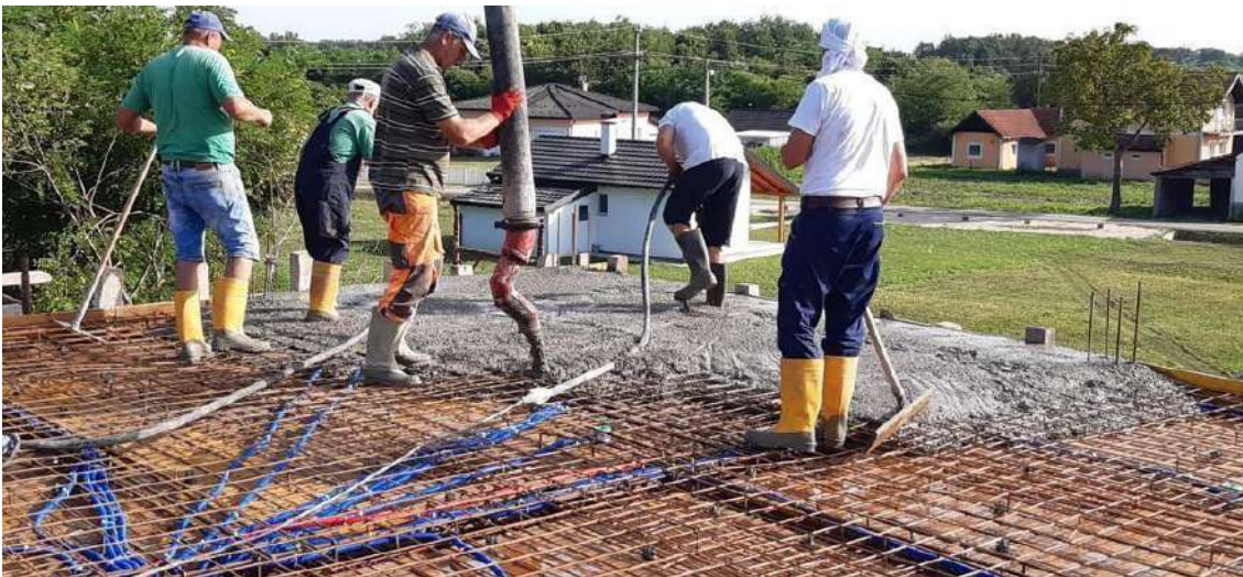
Slika 25. Ugradnja betona

Betoniranje stropne ploče, kontragreda i horizontalnih serklaža odvija se istovremeno, a ugrađuje se beton razreda C30/37 proizveden u vanjskoj betonari. Beton je na gradilište dostavljen kamionima mikserima u dobro organiziranom vremenskom razmaku, kako bi se izbjegli procesi prijevremenog očvršćenja betona zbog dugog vremena čekanja. Beton se do mjesta ugradnje transportirao pumpom zbog velikog volumena betona i visine na kojoj se ugrađuje. (Slike 25. do 27.) Njega betona sastoji se od stalnog njegovanja ugrađenog betona vodom ili pokrivanjem betona građevinskom folijom i naknadnim njegovanjem vodom ispod i preko folije, radi stvaranja uvjeta kondenzacije što rezultira smanjenjem rizika od pojave pukotina u betonu. Obzirom da se proces betoniranja odvijao u vrućim ljetnim danima kada se beton jako brzo suši, vođena je posebna briga o njegovanju betona.