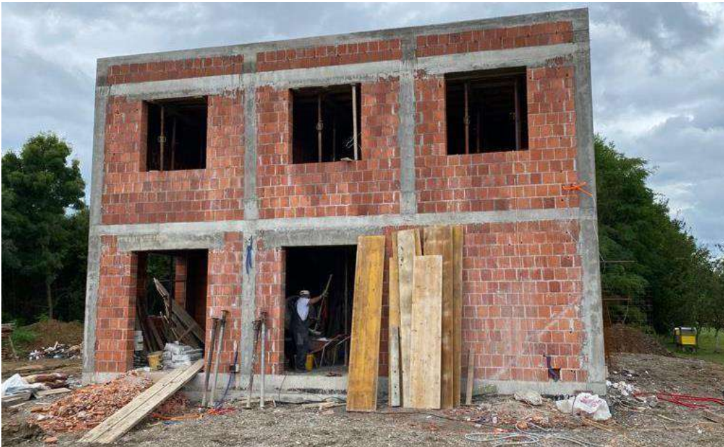
Slika 32. Čeona strana zgrade, završeni armiranobetonski i zidarski radovi

Do sada su prikazani svi glavni armiranobetonski i zidarski radovi. Zbog ponovljivosti procesa proizvodnje na etaži prizemlja i prvog kata više se neće obrađivati već prikazani radovi.