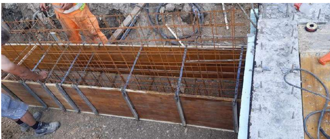
Slika 5. Detalj spoja viših i nižih dijelova temeljne konstrukcije

Zbog različitih visina podrumskih prostorija i prostorija prizemlja, dio temelja izveden je na različitoj dubini u odnosu na većinu temelja (82 cm od postojećeg terena). Viši dio temelja izveden je ubušivanjem armaturnih šipki u već izvedene zidove podruma, čime se ostvaruje ujedinjenje cijele temeljne konstrukcije (Slika 5.).