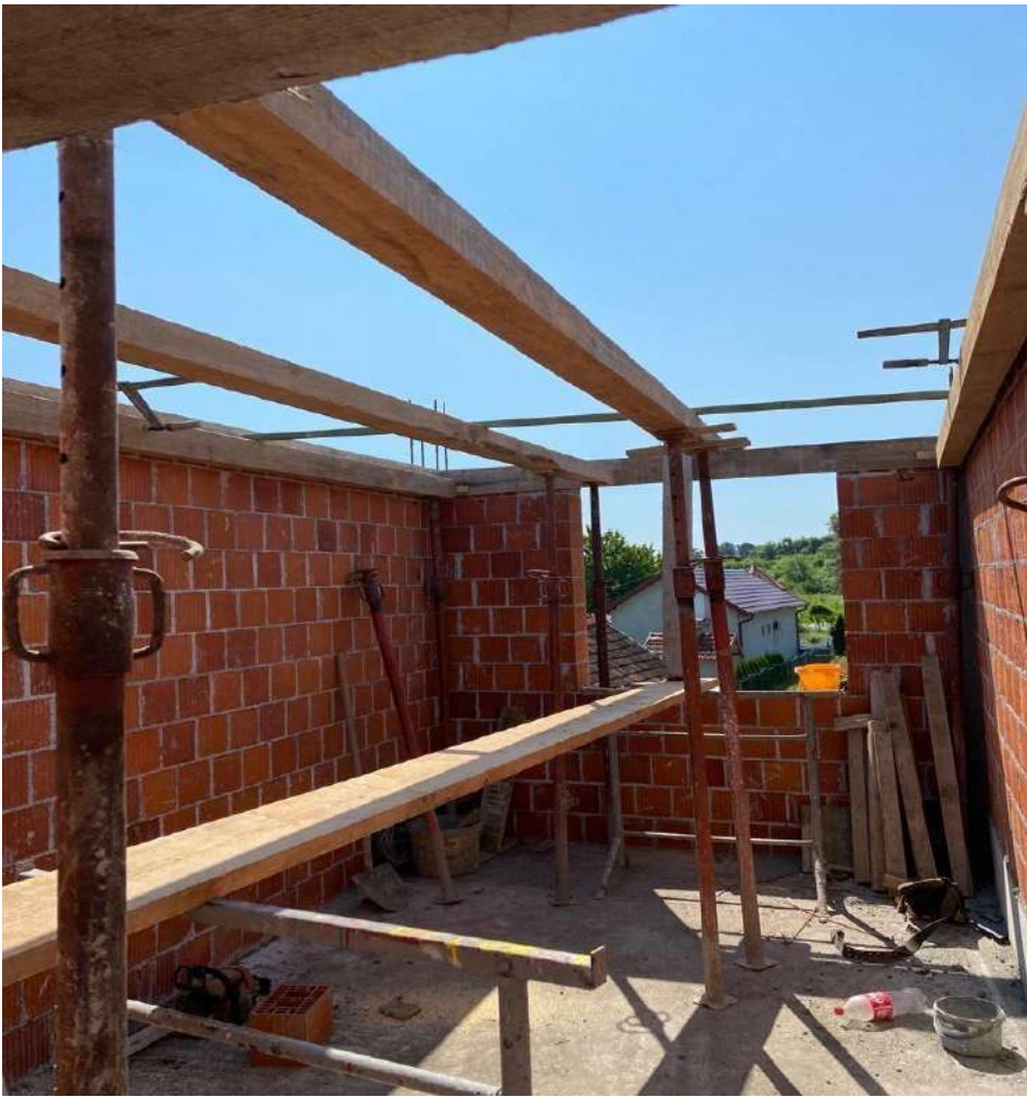
Slika 19. Postavljeni vertikalni stabilizatori i drveni rogovi