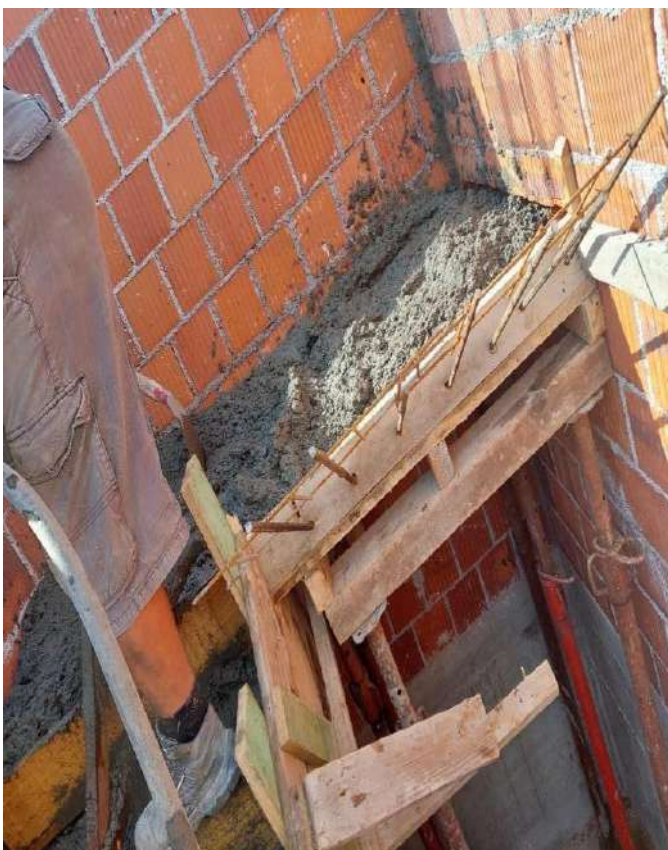
Slika 18. Betoniranje podesta i vibriranje betona iglom