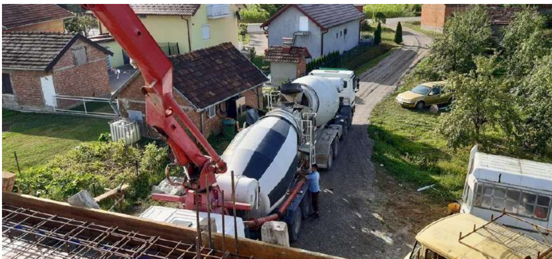
Slika 27. Kamion mikser i pumpa za beton