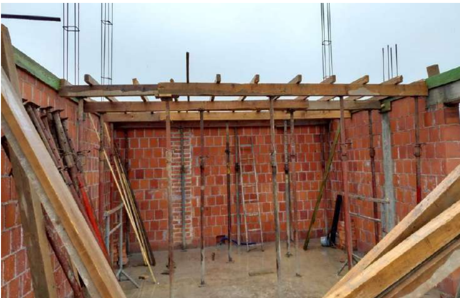
Slika 20. Postavljene drvene štafle