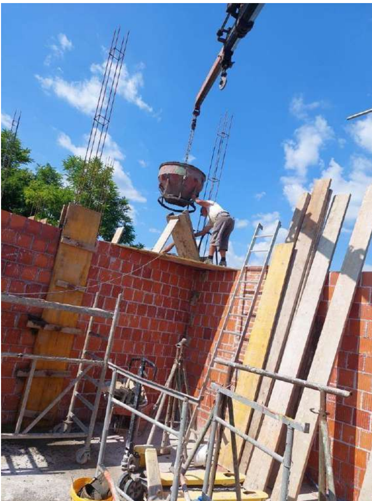
Slika 10. Ugradnja betona u vertikalni serklaž

Serklaži su armiranobetonski elementi čija je primarna zadaća ukrućivanje i povezivanje zidanih zidova i ostvarenje ravnomjernog raspoređivanja opterećenja koje se prenosi s međukatne konstrukcije na zidane zidove. Serklaži mogu biti vertikalni i horizontalni. Horizontalni serklaži postavljaju se u ravnini međukatne konstrukcije, a najznačajniji su za prenošenje horizontalnih sila koje se javljaju uslijed djelovanja potresa. Širina horizontalnih serklaža jednaka je širini nosivog zida (25 cm), a visina je 20 cm. Vertikalni serklaži izvode se na spojevima zidanih zidova, na kutovima i obostranim otvorima između nosivih zidova. Armatura serklaža formirana je s 4 šipke \varnothing 12 mm koje su povezane vilicama. Proizvodnja betona razreda C30/37 odvija se na gradilištu miješalicom. Omjeri u betonu, cement:agregat=1:3. Doziran je po visini od 30 cm, nakon čega se vibrira. Transport od mjesta proizvodnje do mjesta ugradnje odvija se pomoću kamiona sandučara, sipanjem betona iz miješalice u višenamjensku kiblu, te daljnjim transportom do mjesta ugradnje (Slika 10.). Vibriranje betona obavezno je u svim dijelovima serklaža, kao i kod pristupanja svim vrstama armiranobetonskih radova. Vertikalni serklaži se izvode zasebno i pojedinačno (Slika 11.). Horizontalni serklaži izvode se zajedno sa stropnom pločom. Drvena oplata postavlja se i učvršćuje zatezaljkama koje se provlače kroz samu oplatu ili kroz blokove od opeke (Slika 12.).