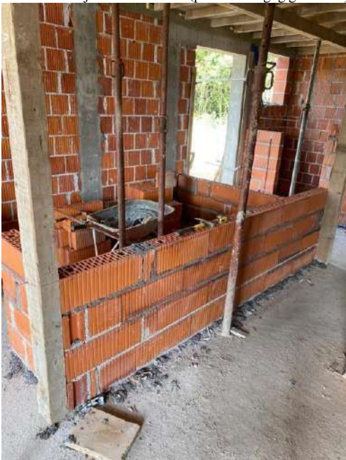
Slika 9. Zidanje pregradnih zidova