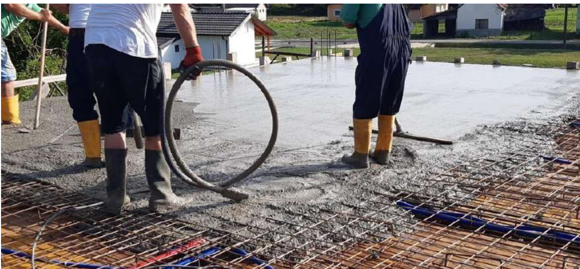
Slika 26. Vibriranje i ravnanje betona