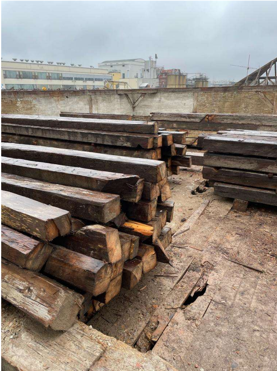
Slika 6 Drvene grede krovišta

motorne pile rezane su nosive grede krovišta. Zbog logističkih problema postavljanje toranjskih dizalica nije bilo moguće u trenutku demontaže krovišta pa su drvene grede rezane na manje komade kako bi se mogle ukloniti pomoću teleskopskog bagera za zahvatnom lopatom, a dio je pripremljen za transport kada se postave toranjske dizalice što je vidljivo na slici 6.