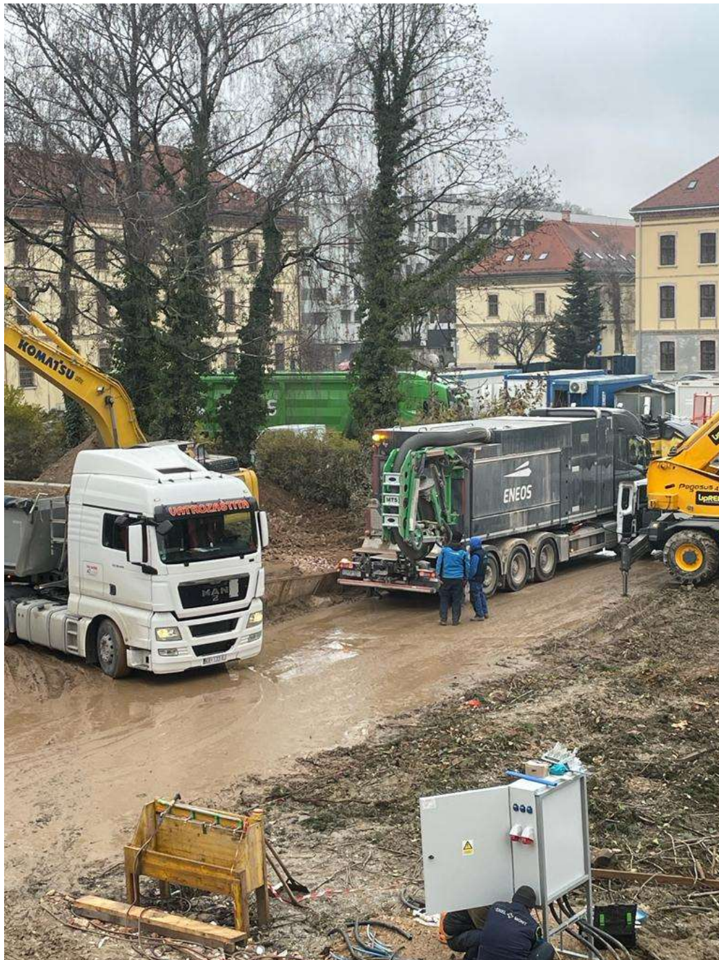
Slika 10 Kamion sa usisnom granom

Sav humus uklonjen s površina za gradilišnu prometnicu i sva iskopana zemlja te usitnjeno granje odvezeni su na odlagalište koristeći kamion s usisnom granom. Kamion je prikazan na slici 10.