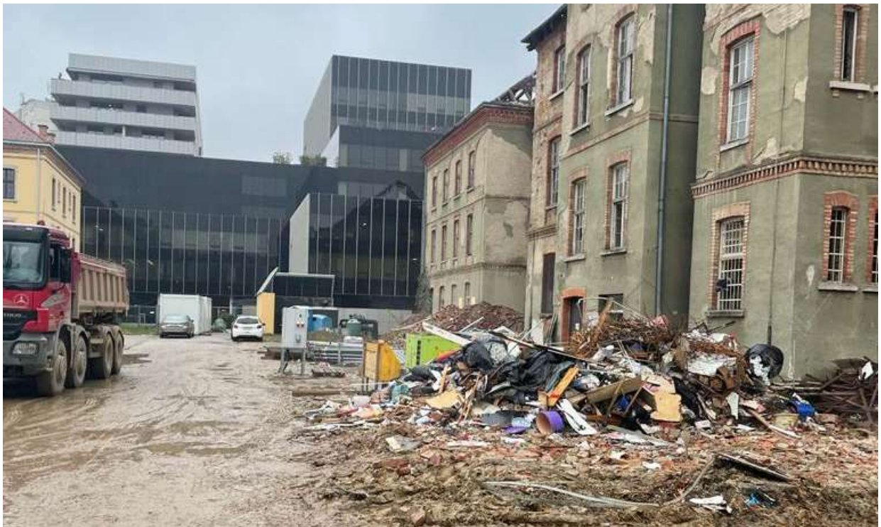
Slika 8 Razvrstavanje otpada na gradilištu 3