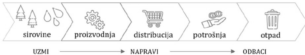
Slika 3 Prikaz koncepta linearne ekonomije (Lovrenčić Butković i Mihaljević, 2021)

ciklus toka materijala po principu kružne ekonomije. Linearna ekonomija zasniva se na konceptu uzmi-napravi-odbaci što ima negativan utjecaj na okoliš, društvo i gospodarstvo u svim industrijama (Lovrenčić Butković i Mihaljević, 2021). Prikaz koncepta linearne ekonomije prikazan je na slici 3.