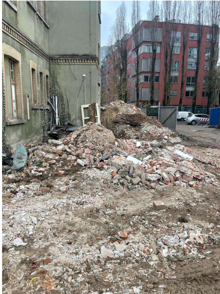
Slika 9 Razvrstavanje otpada na gradilištu 2