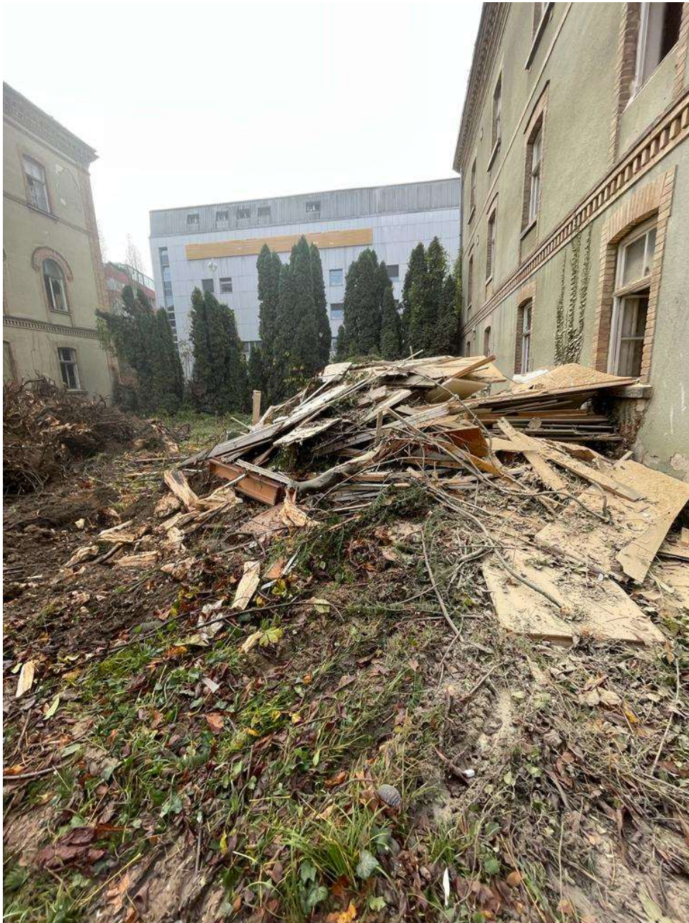
Slika 7 Razvrstavanje otpada na gradilištu 1

pregradnih zidova te zidne i podne obloge u sanitarnim čvorovima uklanjaju se električnim pneumatskih čekićem, klasificiraju kao otpad te se odvoze na odlagalište otpada. Postojeće instalacije grijanja uklonjene su te se svrstavaju u kategoriju građevinskog otpada metali, a moguće je od njih preradom u talionici izraditi limove ili ograde te slične nekonstruktivne elemente. Sav preostali namještaj i predmeti koji su nađeni u zgradama prije početka gradnje pripadaju u kategoriju glomaznog otpada. Gospodarenje otpadom na gradilištu nije samo pitanje ispunjavanja zakonske obaveze već je i dio organizacije gradilišta pogotovo kada se radi o ovako velikom projektu. Sav otpad na gradilištu odvajanje je prema vrsti otpada te načinu njegove ponovne uporabe te lokaciji na koju će se voziti što je vidljivo na slikama 7, 8 i 9.