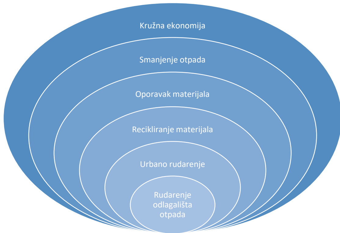
Slika 1 Grafički prikaz temeljnih definicija koje se odnose na oporavak, recikliranje i izvlačenje resursa iz otpada (Cossu i Williamns, 2015)