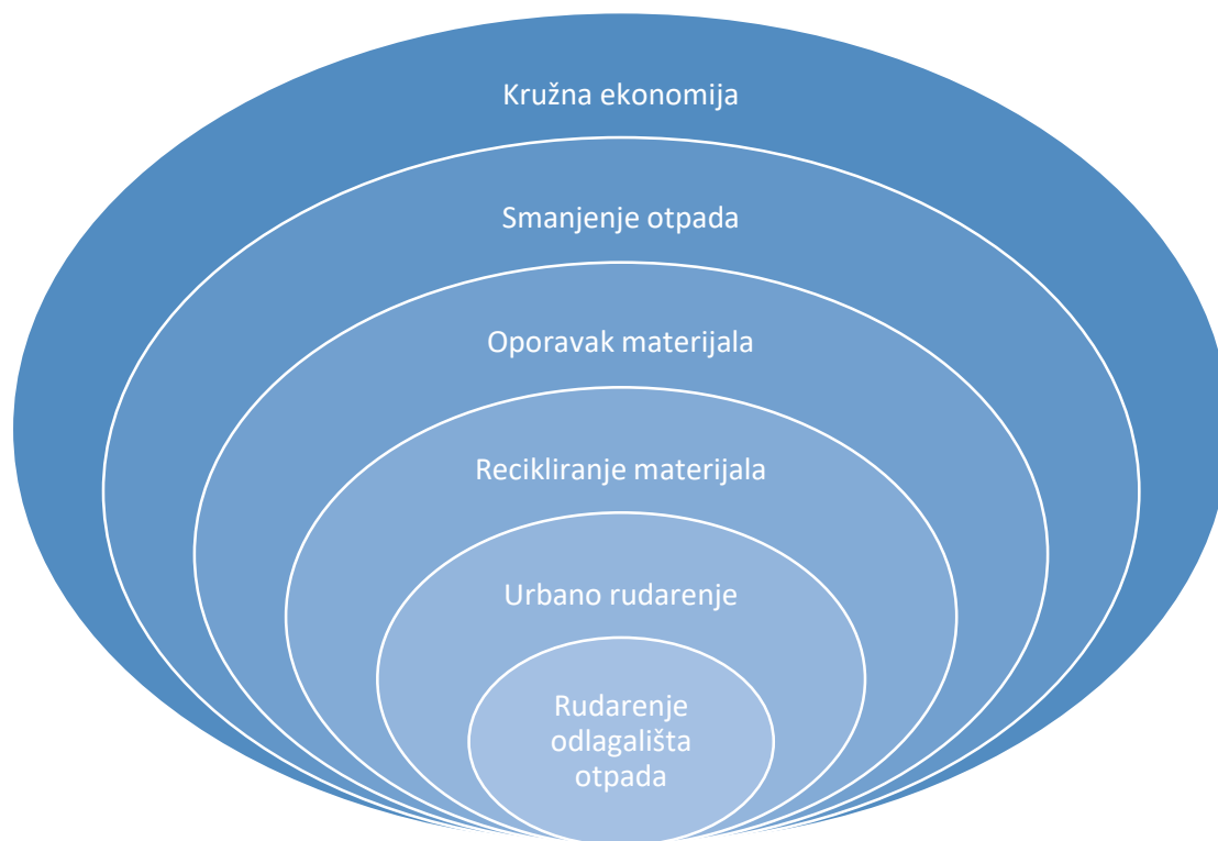
Slika 1 Grafički prikaz temeljnih definicija koje se odnose na oporavak, recikliranje i izvlačenje resursa iz otpada (Cossu i Williamns, 2015)