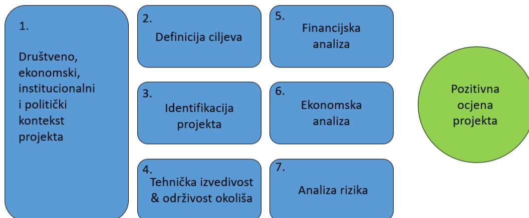
Slika 3 Sedam temeljnih koraka za optimalnu ocjenu projekata (InfoPuls, 2015)

U dijelu koji se odnosi na opis sadržaja projekta navodi se sadašnje stanje društvenog, ekonomskog, političkog i institucionalnog konteksta na području planiranog zahvata u prostoru.