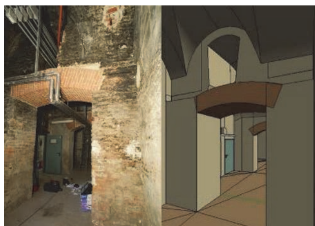
Slika 4. BIM modeliranje nepravilnog zida u dvorcu Valentino [33]

problem se može riješiti automatskim ili poluautomatskim prepoznavanjem elemenata u BIM programskim rješenjima prilikom prebacivanja oblaka točaka iz laserskih snimaka [33].