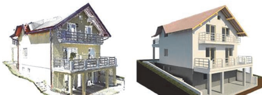
Slika 3. Usporedba oblaka točaka skeniranog objekta i BIM modela [32]

problem se može riješiti automatskim ili poluautomatskim prepoznavanjem elemenata u BIM programskim rješenjima prilikom prebacivanja oblaka točaka iz laserskih snimaka [33].