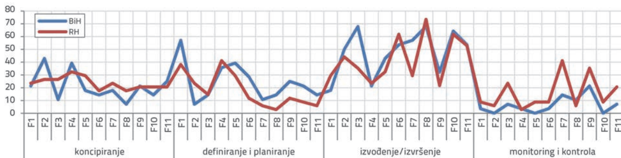
Slika 4. Važnost ključnih faktora po fazama projekta prema voditelju projekta... u BiH i RH