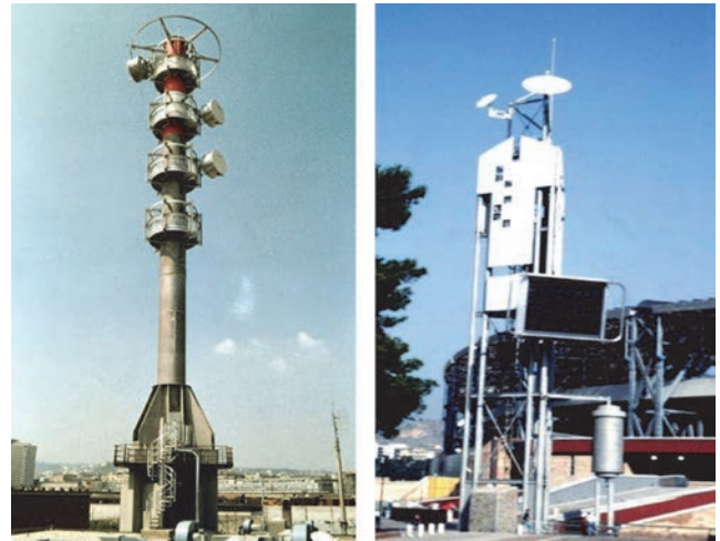
Slika 8. Aluminijски tornjevi, Napulj, Italija

od tla, s prevladavajućom (dominantnom) dimenzijom koja je horizontalna (npr. portalni okviri za prometne znakove) ili je, pak, vertikalna (npr. antene, dalekovodni stupovi i rasvjetni tornjevi). Za sve takve konstrukcije, odsutnost održavanja temeljni je preduvjet. U isto vrijeme, proces ekstruzije može poboljšati geometrijska svojstva presjeka na takav način da se dobije minimalna težina i najviša konstrukcijska učinkovitost. Osim toga, niska težina aluminija omogućuje montažne sustave koji su vrlo laki za transport i montažu, dajući tako konkurentna rješenja u usporedbi s drugim materijalima.