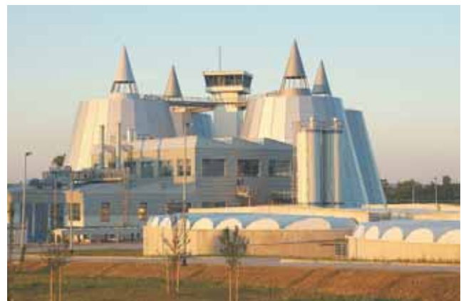
Slika 2. Pogon za obradu mulja (zgušnjavanje, anaerobna stabilizacija, dehidracija)

U slučaju da grad Zagreb ne osigura odlagalište izvan lokacije uređaja, koncesionar je ovlašten organizirati i izvršiti propisno odlaganje i ima pravo naplatiti gradu Zagrebu dogovorenu cijenu za to odlaganje.