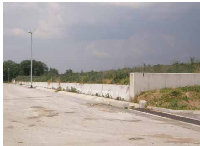
Slika 3. Privremeno odlagalište stabiliziranog i dehidriranog mulja (na lokaciji uređaja)

Tijekom 2009. godine predložen je postupak ECOCYCLING za preradu mulja na CUPOVZ-u [14]. ECOCYCLING je postupak kojim se kruti otpad, uključivo i mulj iz komunalnih uređaja, prerađuje u sekundarnu sirovinu. Taj postupak ne primjenjuje termičku obradu, nema ostataka, niti neugodnih mirisa. U postupku otpad se usitnjava te miješa s dodacima koji su prirodni materijali poput glina, minerala, vapna ili kemikalija koje su na tržištu. Ovisno o vrsti otpada kao i dodacima te provedenom postupku dobije se inertna i stabilna tvar koja se može upotrijebiti u graditeljstvu (u proizvodnji betonskih elemenata) ili u šumarstvu i poljoprivredi kao poboljšavač tla. Za primjenu postupka ECOCYCLING pri preradi mulja na CUPOVZ-u, trebalo bi najprije istražiti moguće tržište, odnosno raspoloživa zemljišta poljoprivredna ili šumska za sadnju primjerice brzorastućih stabala koja bi se iskorištavala kao biomasa u proizvodnji energije. S obzirom na veliku godišnju masu mulja na CUPOVZ-u i na nesigurnost tržišta, a i zbog nedovoljno podataka o primjeni ECOCYCLING postupka za velike uređaje, ta metoda nije dalje razmatrana.