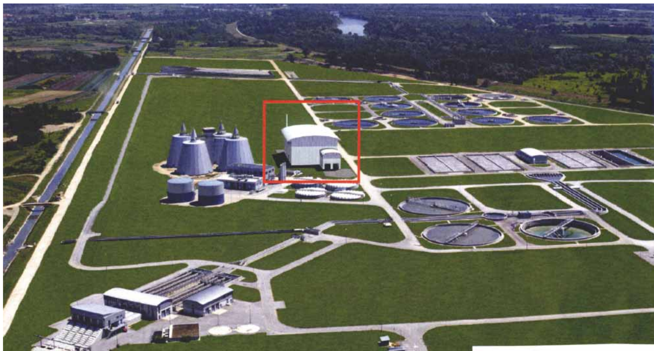
Slika 5. Pogled na CUPOVZ s označenim dijelom prostora za termičku obradu mulja

o monotermskoj obradi mulja. Studija o monotermskoj obradi mulja obuhvaća sve nužne radove za izgradnju postrojenja, uključivo i dodatne radove za zaštitu okoliša [25]. Monospalionica bila bi locirana u neposrednoj blizini objekata za stabilizaciju i odvodnjavanje mulja, slika 5. Vrijeme za izradu projekata, ishodenje potrebnih dozvola te izvedba građevinskih, strojarskih i elektrotehničkih radova, okvirno bi trebalo četiri godine. Kako dosad još nije donesena odluka o konačnom gospodarenju muljem, lako se može utvrditi da u