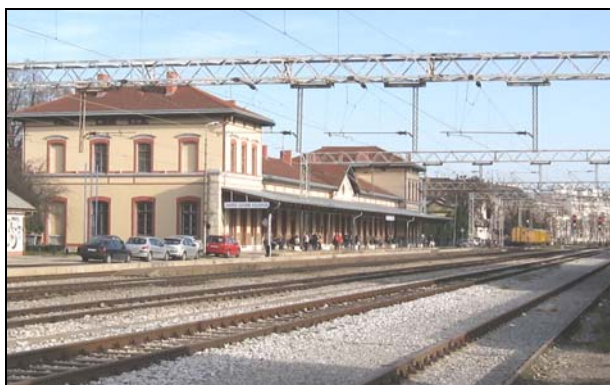
Slika 3. Zapadni kolodvor Zagreb