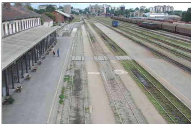
Slika 4. Kolodvor u Osijeku