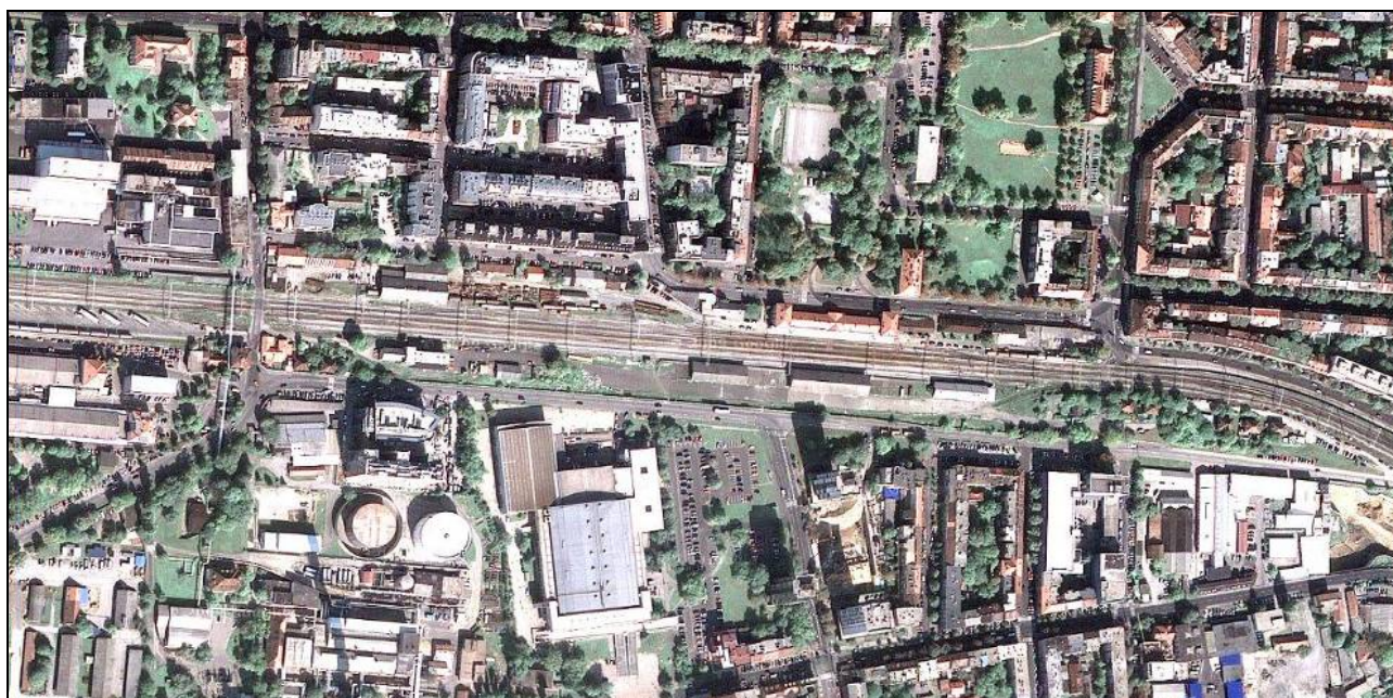
Slika 1. Situacijski prikaz analiziranog područja Zapadnog kolodvora Zagreb