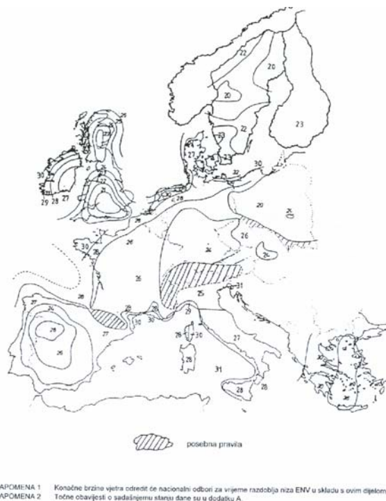
Slika 2. Europska karta vjetra - ENV

Osnovne usporedne brzine vjetra, definirane kao 10-minutne srednje brzine na visini od 10m iznad ravnog tla kategorije hrapavosti II koje se mogu očekivati za povratni period od 50 godina, uglavnom su bitno previsoko određene (usporedba - susjedne jadranske zemlje – slika 2.).