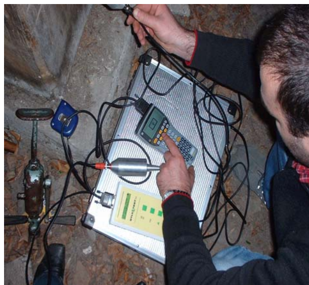
Slika 1 Između bilo koje dvije ulazne i izlazne varijable moguće je uspostaviti grafički tj. funkcijski odnos, npr. U ovom slučaju ( f_{c,90,k} - f_m )

Procedura pomoćne tehnike pri klasifikaciji sastoji se od mjerenja postotka vlažnosti, dimenzija i težine uzoraka. Svi ti ulazni podaci pohranjuju se u memoriju PC-a. Upotrebom jedne od nedestruktivnih tehnika, program izračunava dinamički MOE i kasnije sve karakteristične vrijednosti mehaničkih svojstava drva koje su nam potrebne pri projektiranju drvenih konstrukcija. Naravno, podrazumijeva se da neuralna mreža primijeni na što više uzoraka koji su i destruktivno ispitani te da se njezini rezultati stalno testiraju nakon određenog broja prolaza.