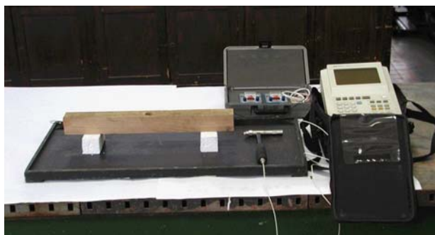
Slika 2. Ultrazvučno mjerenje MOE u