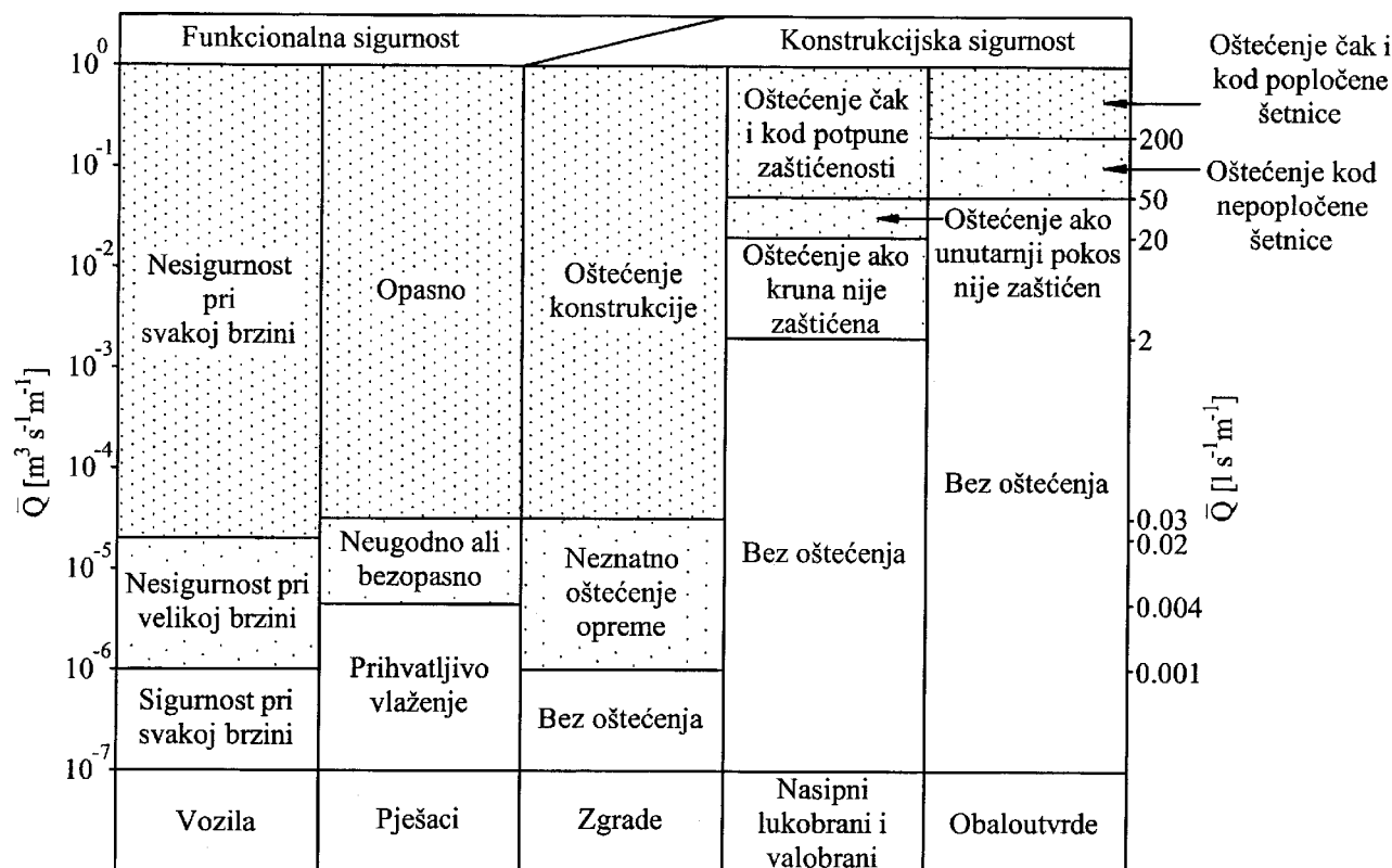
Slika 2. Kritične vrijednosti srednjeg preljevog protoka [14]

Oba netom opisana modela valnog preljevanja imaju slične razine podudaranja s izvornim eksperimentalnim