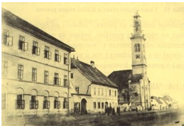
Slika 12. Stara vojna bolnica i Petrova crkva u Vlaškoj ulici, također su stradale u potresu