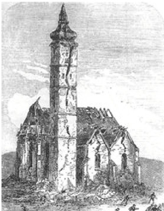
Slika 5. Crtež povodom zagrebačkog potresa iz njemačkih novina

poznati hrvatski znanstvenik, akademik dr. Gjuro Pilar napisao znanstveno djelo [5] u kojem je sadržano i razmatranje o zagrebačkom potresu.