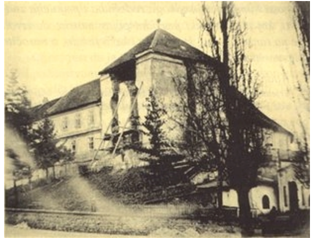
Slika 9. Gornji grad. Popov toranj – zvjezdarnica