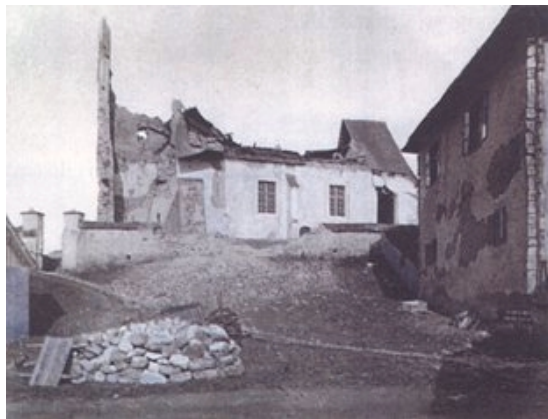
Slika 16. Crkva u Granešini pripadala je u potresu najrazorenijim građevinama

Opis posljedica potresa dalje je prikazan za prigradska naselja: Šestine, Vrabče, Stenjevec, Bistra, Brdovac, Samobor, Kerestinec, Stupnik, Remete, Sv. Šimun, Granešina, Čučerje, Resnik, Nart, Prozorje, Sesvete, Vugrovac, Kašina, Sv. Ivan Zelina i Sv. Helena kod Zeline.