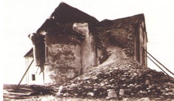
Slika 20. Razorena kuća na Kraljevom vrhu

Na kraju tekstualnog dijela Izvjehća u V. poglavlju dan je pregled potresa izvan Hrvatske i Slavonije “ po ostalih stranah svieta za vrijeme od 1. studenoga 1880 do 1. studenoga 1881 ”. Podaci obuhvaćaju sve potrese u svijetu koji su se dogodili za godinu dana, a dani su po mjesecima (studen 1880. do listopada 1881.).