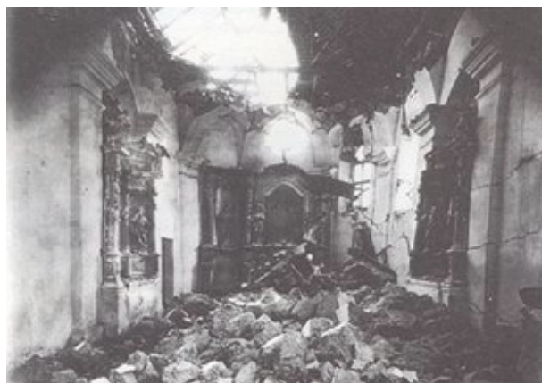
Slika 18. Unutrašnjost crkve u Kašini nakon potresa

značenje šumova uz potres, “znakovi na zgradah” , znakovi na zemljinoj površini, pojave na vodi. Kritički se razmatra odnos potresa s “metereolojskim” pojavama. Govori se o zabludama s tim u vezi. Iznosena su zapažanja i o ponašanju životinja uoči i za trajanja potresa.