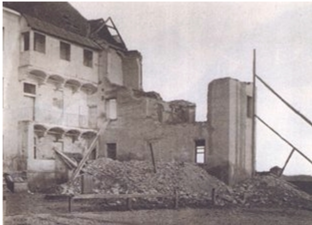
Slika 15. Razorena zgrada negdašnjeg isusovačkog samostana na Jezuitskom trgu (C. K. GLAVNO ZAPODJENIČTVO)

U odjeljku pod naslovom “Potresi što su poslije glavnoga u Zagrebu zabilježeni” , popisani su svi zabilježeni potresi koji su se dogodili nakon glavnoga s podacima o datumu, vremenu i osnovnim opisnim podacima. U popisu ih ima 199, a na kraju se konstatira: