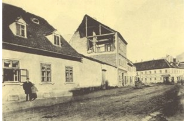
Slika 13. Razaranja u Marovskoj ulici (današnja Masarykova)