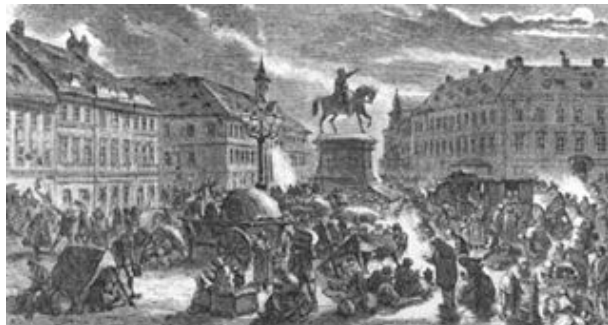
Slika 3. Jelačićev trg neposredno nakon potresa (crtež)