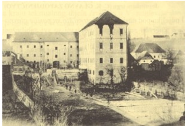
Slika 14. Dio Zagreba nakon potresa

Uz opis oštećenja za Crkvu sv. Marka kaže se: "... oštećena je tako, da se morala zatvoriti, te se nije mogla nutri služba božja vršiti."