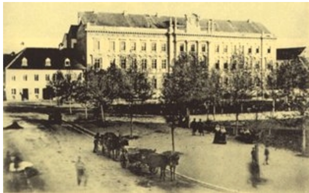
Slika 7. Zgrada Županijskog suda na Zrinjercu iz doba potresa

Na kraju I. dijela dan je pregled potresa od 9. studenoga izvan Hrvatske i Slavonije – “po ostalih stranah naše monarkije.” (Primorje, Bosna, Ugarska, Kranjska, Štajerska, Koruška, Dolnja Austrija i Češka).