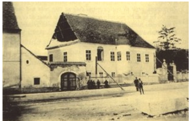
Slika 10. Kurija na Kaptolu također je stradala u potresu

Ovdje ćemo se zadržati samo na onim dijelovima I. poglavlja koji se odnose na Zagrebačku županiju, prije svega na Zagreb.