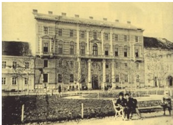
Slika 8. Arheološki muzej na Zrinjercu bio je oštećen u potresu