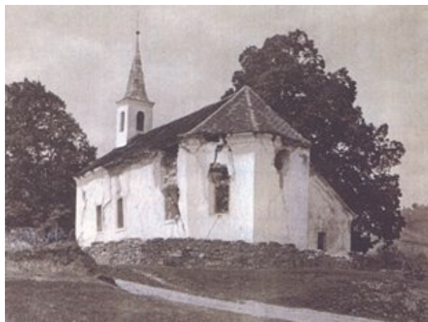
Slika 17. Crkva u Kašini je potpuno razorena

Opisuje se važnost ispravnog opažanja pojava prigodom potresa na temelju kojih se može utvrditi smjer potresa jer se “izvješća s jednoga te istoga mjesta ne slažu.” Ovdje se rasuđuje o potresu kao “valovitom ljuljanju zemlje” . Opisuje se i kako se s pomoću ura može utvrditi smjer potresa. Navode se i drugi indikatori smjera potresa. Nadalje su opisani načini utvrđivanja vrste potresa,