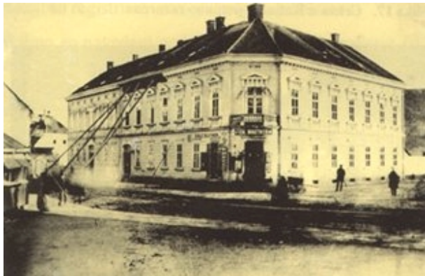
Slika 11. U potresu oštećena zgrada na uglu Vlaške i Draškovićeve

U Gornjem gradu "Crkva sv. Katarine postradala je grozno". Potanko se opisuju oštećenja vanjska i unutarnja.