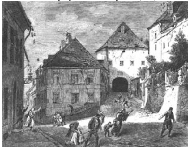
Slika 4. Kamenita vrata u potresu (crtež)