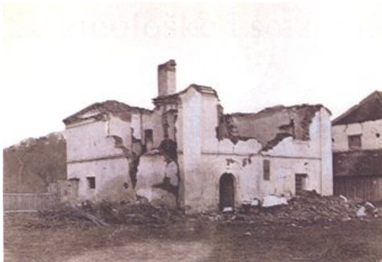
Slika 19. Srušena kuća u Kustošiji

prvom dijelu članka rečeno, istraživanja provedena mnogo godina kasnije potvrdila su vjerodostojnost teorijskih Torbarovih razmatranja.