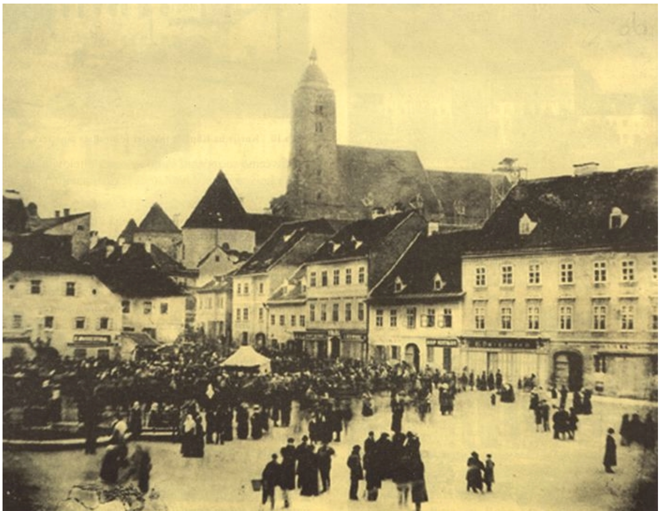
Slika 6. Pogled na Jelačićev trg i dio Bakačeve ulice te na katedralu, u danima potresa

Molimo uljudno, da se odgovori na ova pitanja pošalju čim prije i to il jugoslavenskoj akademiji, ili pako mete-