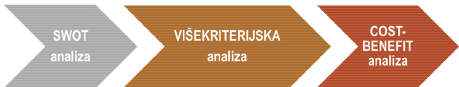
Slika 3. Redosljed primjene metoda vrednovanja

Redosljed primjene opisanih metoda vrednovanja [9, 10, 11] (slika 2.) u praksi je "korak po korak" od niže prema višoj razini. Vrednovanje svakom pojedinom metodom rezultira donošenjem odluke. Za donošenje odluke na višoj razini primjenjuje se sljedeća metoda u nizu, unatoč činjenici da je za određivanje nekih parametara potrebna njihova kombinacija [15].