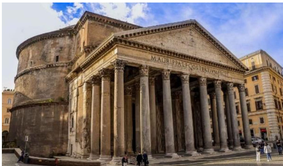
Slika 1.: Rimski hram Panteon

Beton je materijal koji se koristi u građevinarstvu, smjesa cementa, agregata, vode, zraka i aditiva koji omogućuju manipulaciju njegovih karakteristika. Počeci betona sežu sve do drevnih civilizacija, a neke od tih građevina opstale su do danas, primjerice egipatske piramide. Usavršili su ga Rimljani korištenjem vulkanskog pepela i vapna, omogućivši izgradnju veličanstvenih građevina poput Koloseuma i Panteona. Nakon pada Rimskog Carstva, svi izumi i znanja o betonu padaju u zaborav sve do 18. stoljeća. Joseph Aspdin 1824. godine izumio je portlandski cement, što je označilo početak razvoja suvremenog betona.