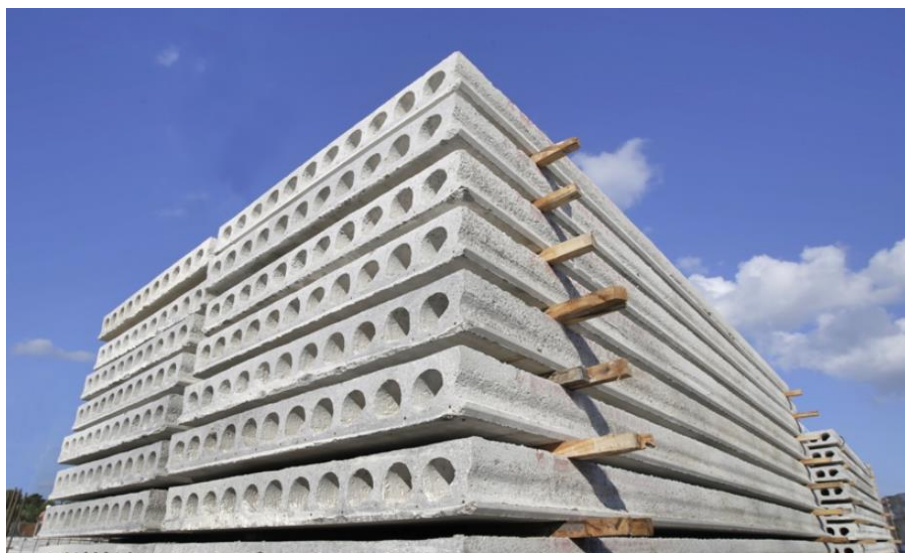
Slika 10.: Stvrđnjavanje ošupljenih betonskih ploča

Sljedeća faza proizvodnje prefabriciranog armiranobetonskog elementa konstrukcije je stvrđnjavanje. Ovisno o uvjetima okoline te vrsti betona koja je korištena, ovaj postupak može trajati i nekoliko dana. Za to vrijeme, važno je konstantno održavati potrebnu vlažnost betona te ga zaštititi od nepovoljnih utjecaja okoline. Na taj način osigurava se pravilno sazrijevanje cementa te dobiva maksimalna čvrstoća strukture. [12]