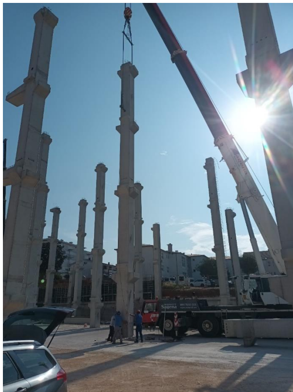
Slika 4.: Montaža prefabriciranog betonskog konstrukcijskog stupa