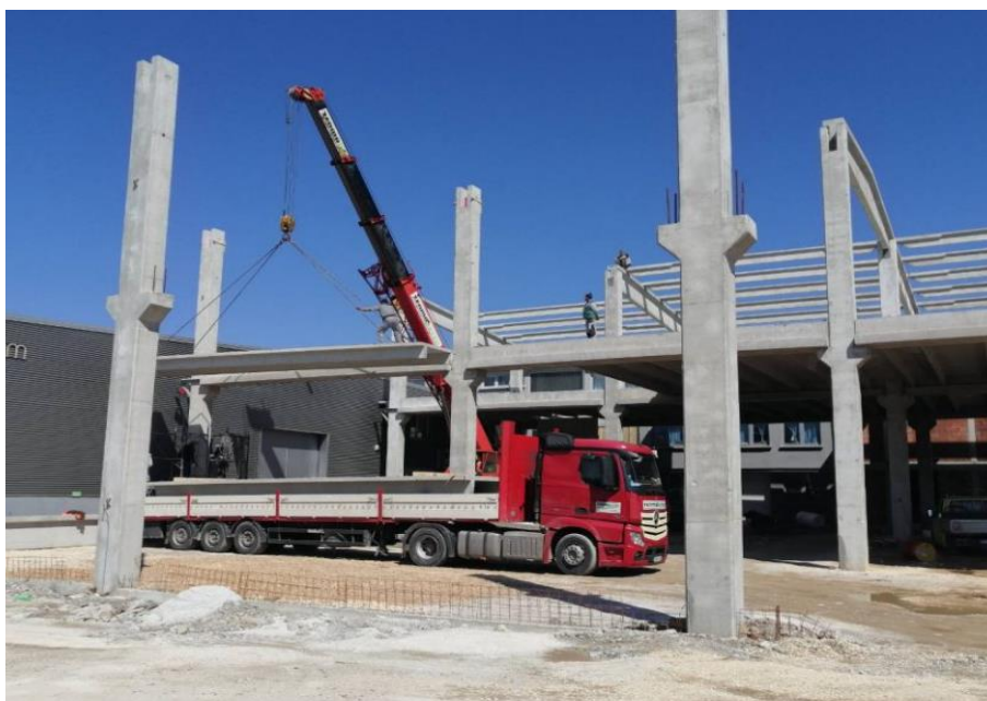
Slika 11.: Montaža elementa izravno s transportnog sredstva

Dolaskom na gradilište, mora biti osiguran deponij na koji će se navedeni elementi skladištiti. Ukoliko je organizacija gradilišta takva da se prijenos elementa vrši izravno iz prijevoznog sredstva, ono mora biti unutar operative zone dizalice. [13]