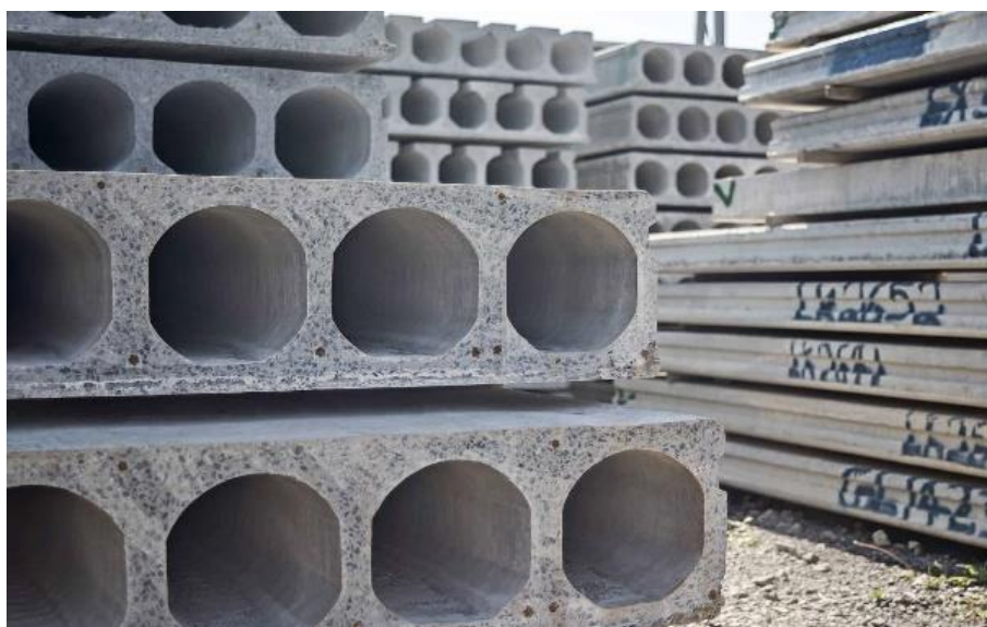
Slika 5.: Šuplje prefabricirane armiranobetonske ploče