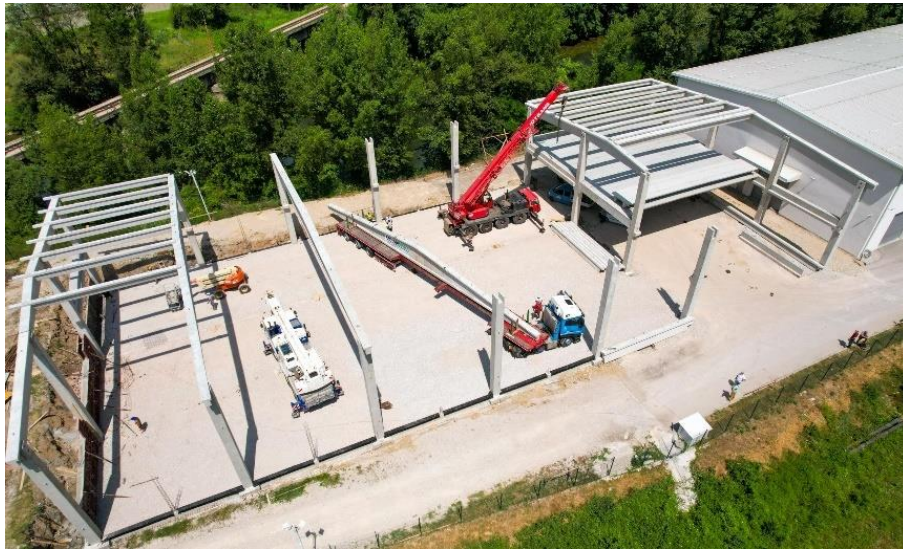
Slika 12. : Montaža uz pomoć autodizalice

Nadalje, ključno je analizirati statičke sustave elemenata tijekom i po završetku montaže kako bi se osigurala statička ravnoteža. Također je potrebno pravilno dimenzionirati ugrađena sredstva kao što su kuke i sustavi za obuhvaćanje te raspored mjesta zahvaćanja. [5]