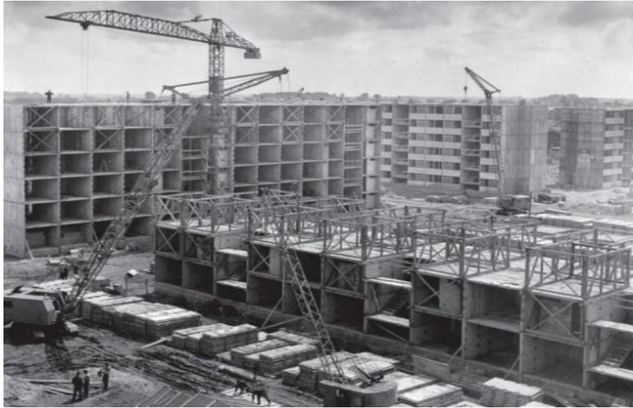
Slika 3.: Sustav JU-61

Moderni načini prefabrikacije u građevinskoj industriji su ,zbog razvoja tehnologije i dostupnosti materijala, dosegli visoke razine. Danas postoji nekoliko različitih tehnika montažne gradnje koje su postale svakodnevica u građevinskoj industriji. Najučestaliji primjer je izrada modularnih komponenti. Obično se sastoje od osnovne jedinice ili nekoliko njih te se povezuju u cjeline kao što su zidovi, podovi, stupovi i slično. Osim modularnih komponenti značajne su vanjska montaža te automatizirana izgradnja. Vanjska montaža podrazumijeva izradu komponenti i instalacija izvan gradilišta, uz veću preciznost i smanjenu mogućnost pogreške. S druge strane, automatizirana izgradnja radi se uz pomoć robota i automatiziranih strojeva, obuhvaća instaliranje komponenti te druge procese, primjerice zavarivanje i bojanje.