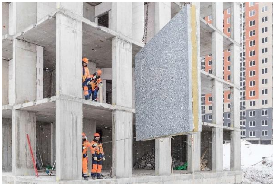
Slika 7.: Ugradnja sendvič panela

Nenosive prefabricirane fasadne obloge od betona nemaju strukturnu funkciju, no daju arhitektonsku završnicu zgrade te je štite od vremenskih uvjeta. Dva najčešća tipa ovih obloga su Thin-Shell i GFRC. Thin-Shell (zidna ploča s tankom ljuskom) je obloga koja se sastoji od tanke vanjske strane betona i pomoćnog sustava koji je povezuje sa strukturom zgrade. GFRC ( Glass Fiber-Reinforced Concrete) je također sustav tankih ljuski. U vanjski dio betona dodaju se staklena vlakna otporna na alkalije, a ovaj oblik dobiva se prskanjem vlakana u kalupe. Na taj način povećava se savojna, udarna i vlačna čvrstoća obloge. [9]