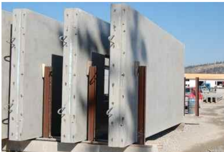
Slika 6.: Nosivi predgotovljeni betonski zidovi