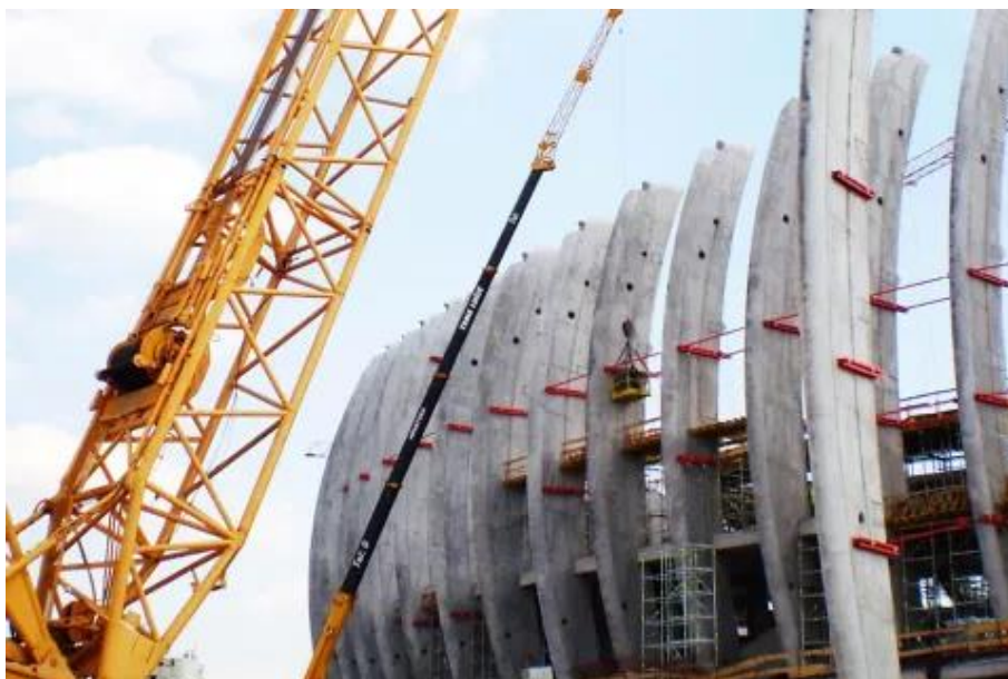
Slika 16.: Montaža stupa (Izvor [14])

Na vrhu stupova smještena je točka za sidrenje kablova namijenjenih za nošenje krovne konstrukcije. Viseća čelična krovna konstrukcija izrađena je od čeličnih profila raspoređenih u glavnom i sekundarnom smjeru. Stabilnost i dinamika konstrukcije osigurani su pravilnom raspodjelom opterećenja i mogućnošću zamjene kablova. [14]