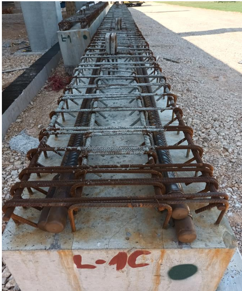
Slika 14.: Detaljan prikaz vezne grede (Izvor [17])