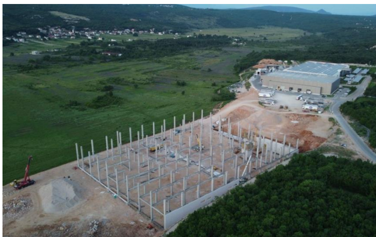
Slika 13.: Tvornica u fazi montaže

Objekt tlocrtno zauzima oko 15 000 m 2 površine te je jedan od većih projekata na tim prostorima. Proizvodnju i montažu elemenata potpisuje tvrtka „Širbegović Inženjering“ koja je jedna od dominantnijih u pogledu predfabrikacije u cijeloj Bosni i Hercegovini.