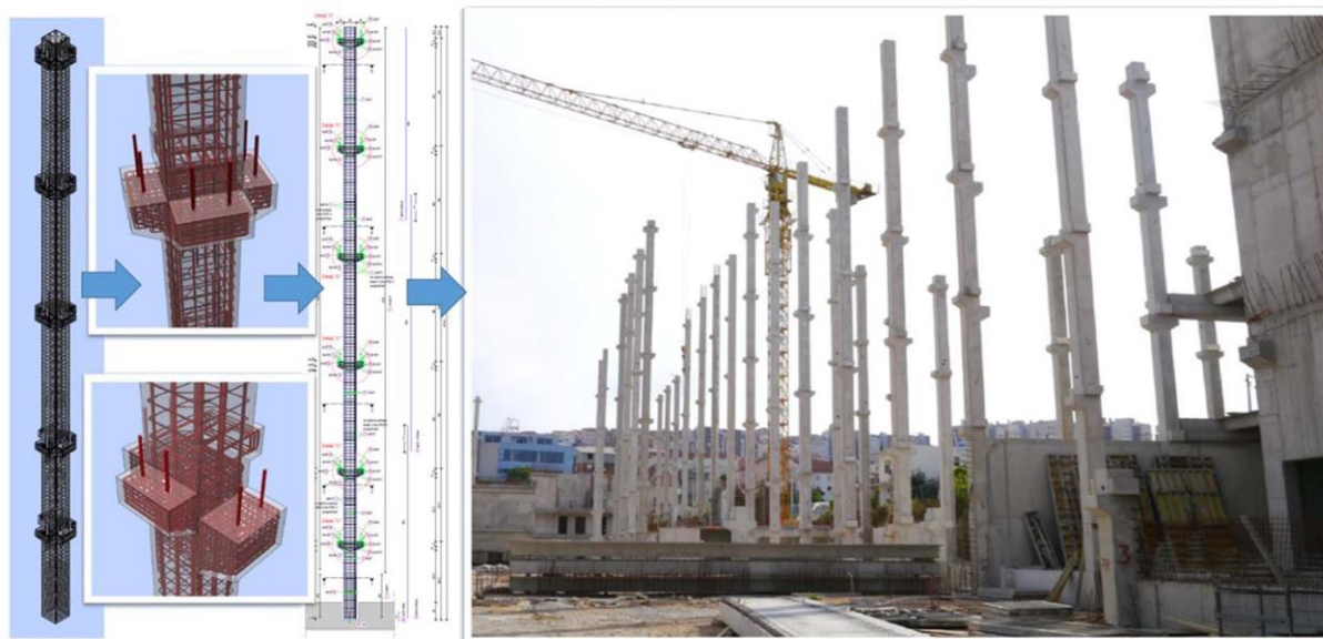
Slika 19.: Detalj konzole na stupu (Izvor [15])

Posebnost ovog projekta je to što je objekt projektiran bez dilatacija, što znači da zgrada nema standardne konstrukcijske razmake koji obično omogućuju širenje i skupljanje materijala zbog temperaturnih promjena. Ovakvo rješenje zahtijeva iznimno precizno projektiranje i primjenu naprednih materijala koji su u stanju podnijeti ove izazove bez kompromitiranja stabilnosti zgrade. Tijekom izgradnje, projektiranje i izvedba objekta odvijali su se paralelno, čime je ostvarena veća efikasnost i ubrzan proces gradnje. [15]