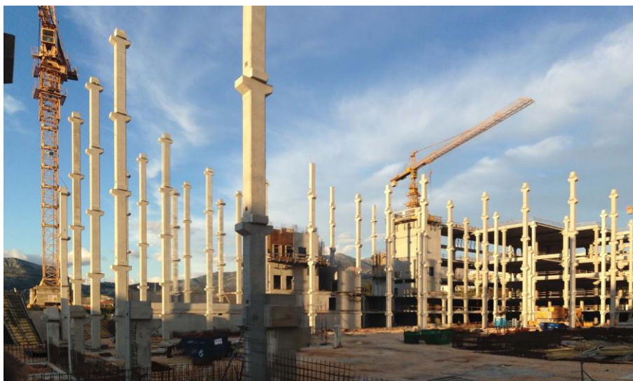
Slika 18.: Objekt u fazi montaže

Trgovački centar Mall of Split, s ukupnom površinom od 180.000 m 2 , izgrađen je u razdoblju od 2011. do 2015. godine u Splitu. Kao najveći trgovački centar na hrvatskom priobalju, Mall of Split predstavlja značajan građevinski poduhvat, a projektiranje glavne i izvedbene konstrukcije povjereno je tvrtki Kap4.