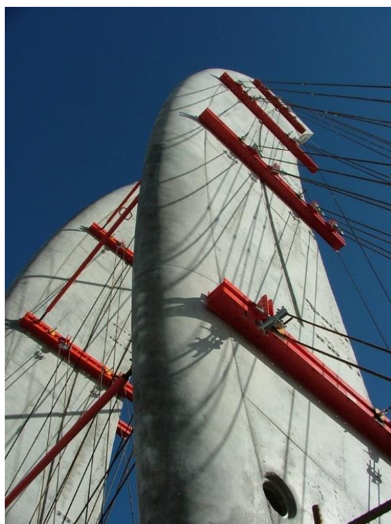
Slika 17.: Detalj sidrenja kablova na stupu

Na vrhu stupova smještena je točka za sidrenje kablova namijenjenih za nošenje krovne konstrukcije. Viseća čelična krovna konstrukcija izrađena je od čeličnih profila raspoređenih u glavnom i sekundarnom smjeru. Stabilnost i dinamika konstrukcije osigurani su pravilnom raspodjelom opterećenja i mogućnošću zamjene kablova. [14]