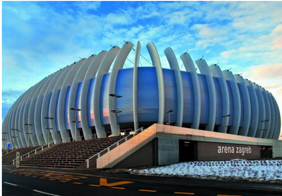
Slika 15.: Dovršena konstrukcija Arena Zagreb

Arena Zagreb višenamjenska je zatvorena dvorana s površinom od 90 340 m 2 te se nalazi u jugozapadnom dijelu Zagreba. Projekt je izradio arhitektonski ured UPI-2M te je dovršena 2008. godine.