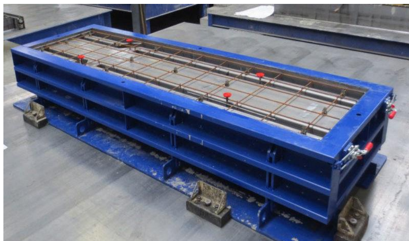
Slika 9.: Kalup za predgotovljeni AB nosač

Nakon projektiranja slijedi stvarna proizvodnja u tvornici. U taj proces spada analiza, ispitivanje i provjera kako bi se po završetku dobio certificirani proizvod s pripadajućom tehničkom dokumentacijom. Tijekom proizvodnje prefabriciranih elemenata ključno je postizanje i održavanje zahtijevane kvalitete betona. Tvornička kontrola provodi razne mjere i ispitivanja opreme, materijala te betona u svim fazama kako bi propisani zahtjevi bili zadovoljeni. [5]