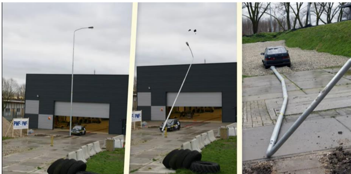
Slika 4.9. Pokusni sudar pri brzini od 35 km/h [19]