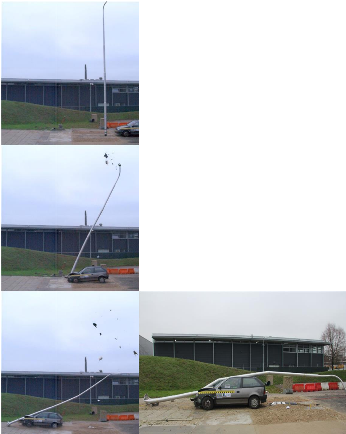
Slika 4.2. Pokusni sudar s visokoapsorbirajućim stupom [16]