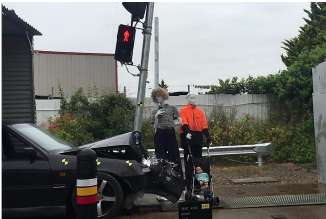
Slika 4.4. Pokusni sudar sa stupom koji apsorbira kinetičku energiju [18]

Na slici 4.4. prikazan je pokusni sudar sa stupom koji apsorbira kinetičku energiju.