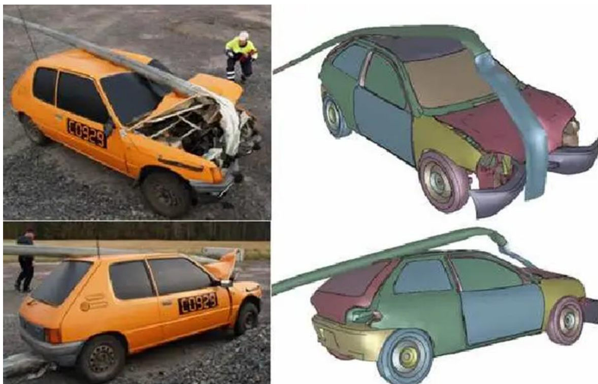
Slika 4.3. Vozilo nakon zaustavljanja [17]

Na slici 4.3. prikazano je vozilo nakon zaustavljanja. S lijeve strane slike nalazi se pokusni sudar, a s desne strane slike nalazi se numerička simulacija.