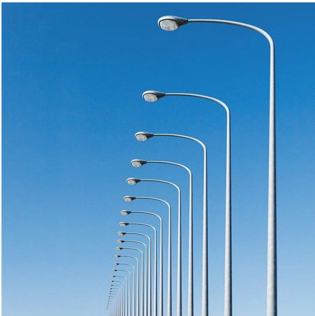
Slika 3.8. Aluminijski rasvjetni stupovi [11]

Na slici 3.8. prikazani su aluminijski rasvjetni stupovi.