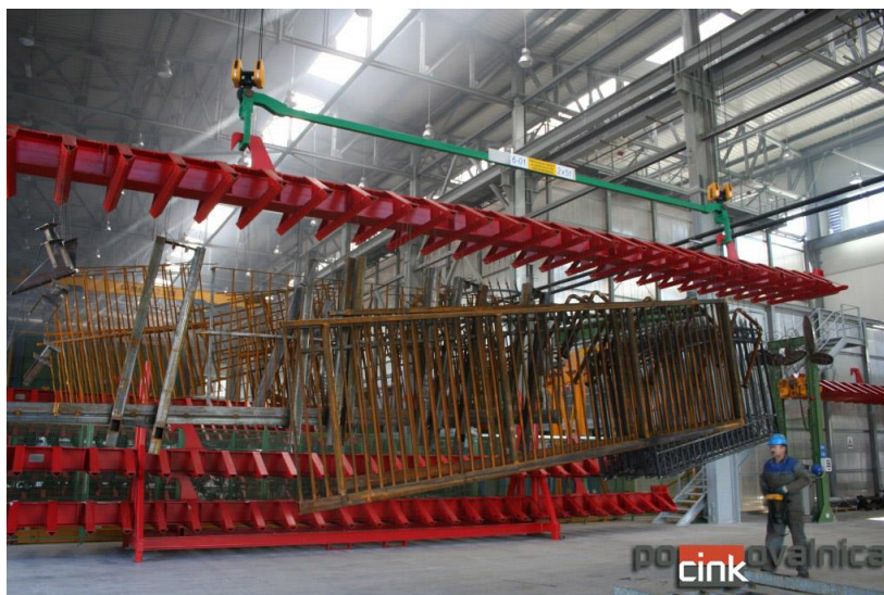
Slike 3.2. Slaganje elemenata [7]

Na slikama 3.2., 3.3., 3.4. i 3.5. prikazan je proces vrućeg pocinčavanja koji je prethodno opisan.