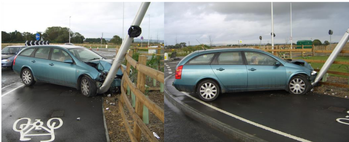
Slika 4.6. Sudar vozila s niskoapsorbirajućim stupom [16]