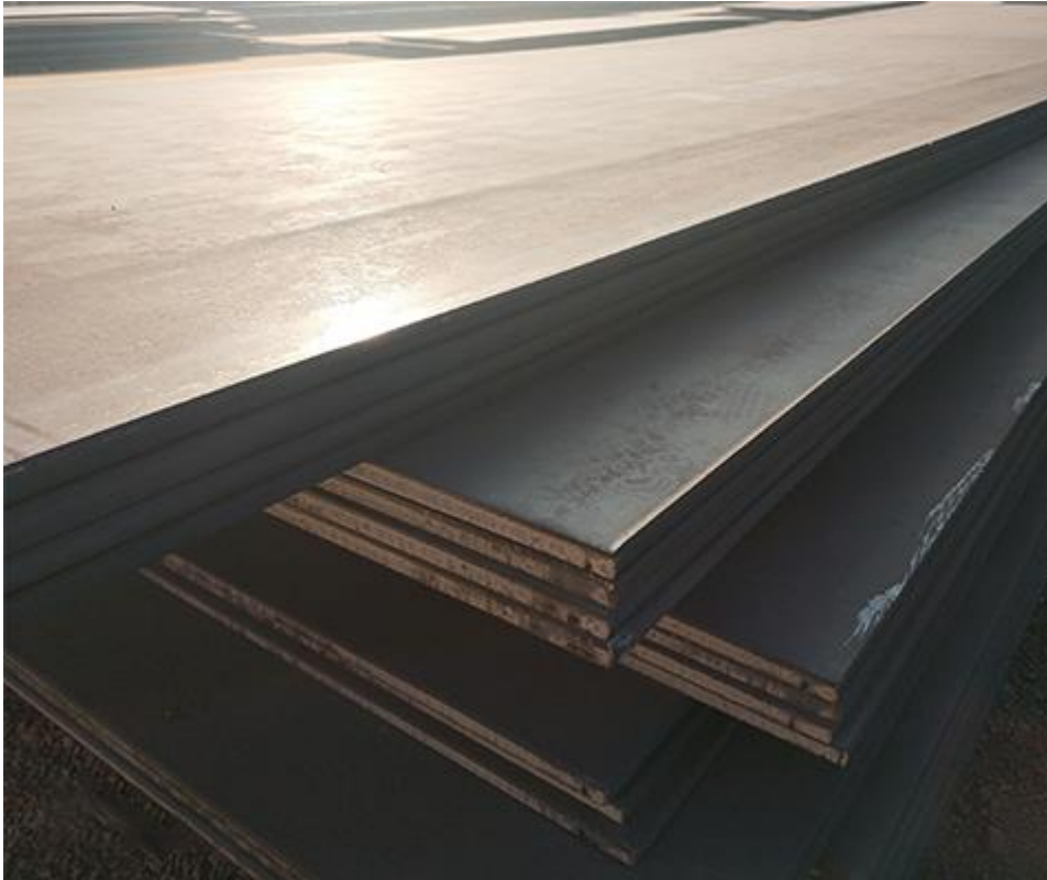
Slika 3.7. Čelik otporan na atmosferske utjecaje [9]