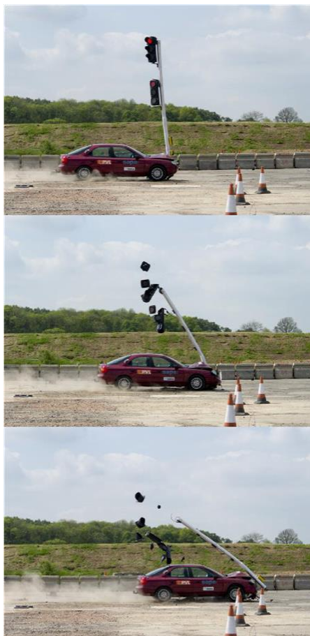
Slika 4.10. Sudar vozila s prometnim signalnim NE stupom [16]

Na slici 4.10. prikazan je primjer demonstracije sudara vozila s prometnim signalnim neenergetskim stupom. Može se vidjeti da se signalni stup srušio pri čemu se vozilo minimalno usporilo, što dovodi do toga da su potencijalni putnici bili zaštićeni od teških ozljeda.