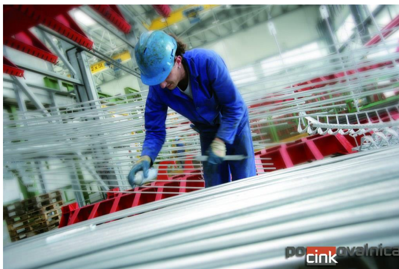
Slike 3.5. Razdvajanje, čišćenje i pakiranje [7]

Trajanje antikorozivne zaštite nakon postupka vrućeg pocinčavanja obično se procjenjuje na 15 do 20 godina. Prema standardu EN ISO 1461, čelični dijelovi mogu se dodatno obojiti, čime se vijek trajanja može produžiti na 30 godina [3].