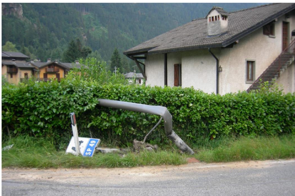
Slika 4.5. Aluminijski LE stup [16]

Na slici 4.5. prikazan je aluminijski LE stup, dok je na slici 4.6. prikazan sudar vozila s niskoapsorbirajućim stupom.