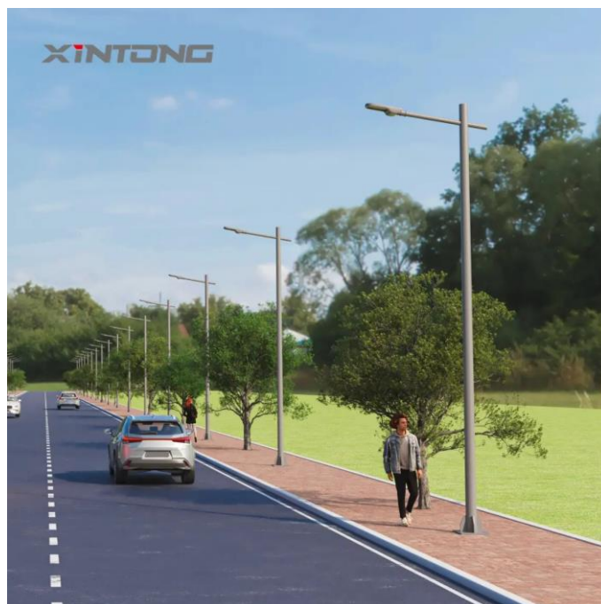
Slika 3.1. Pocinčani čelični stup [5]

Na slici 3.1. prikazan je pocinčani čelični stup.