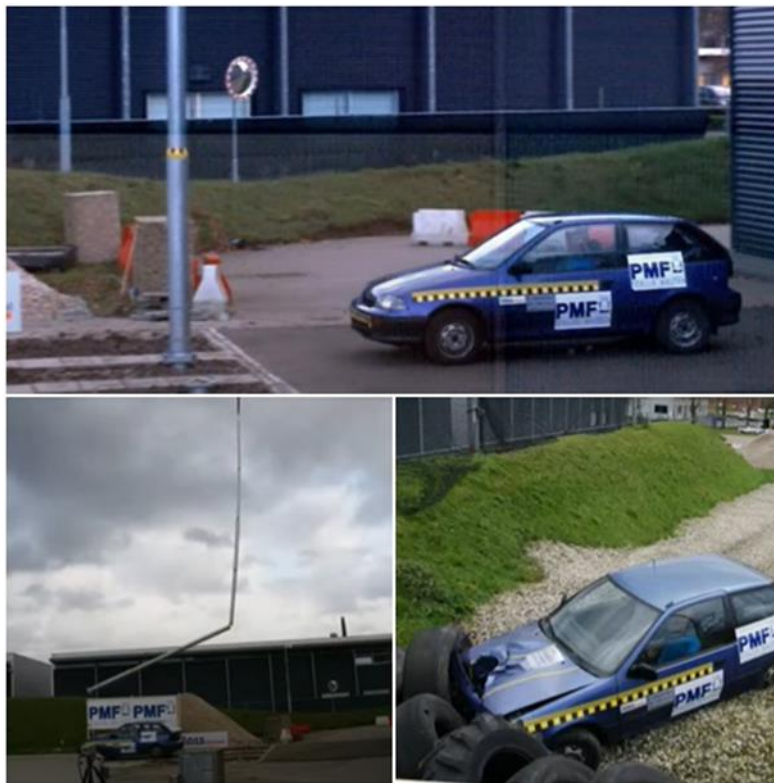
Slika 4.8. Pokusni sudar pri brzini od 100 km/h [19]

Pokusni sudari provode se pri brzinama od 35 i 100 km/h. Na slici 4.8. prikazan je pokusni sudar pri brzini od 100 km/h, pri čemu je vidljivo da se stup potpuno slomio i pao iza vozila, koje se nastavilo kretati smanjenom brzinom. Kako bi stup zadovoljio kriterije klasifikacije za ispitivanu brzinu, nakon sudara vozilo mora imati minimalnu brzinu od 70 km/h, koja se mjeri 12 metara iza mjesta sudara [3].