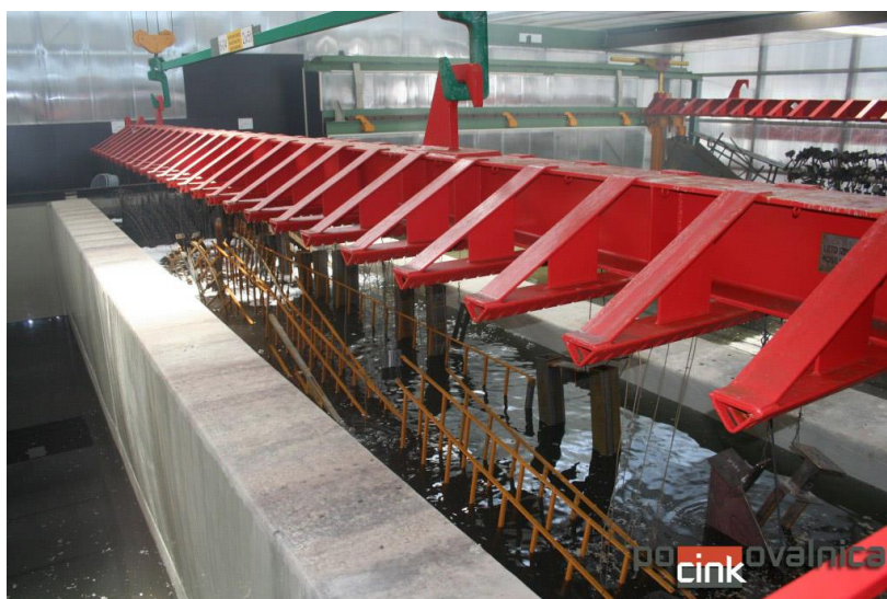
Slike 3.3. Kemijsko čišćenje i pretpriprema [7]