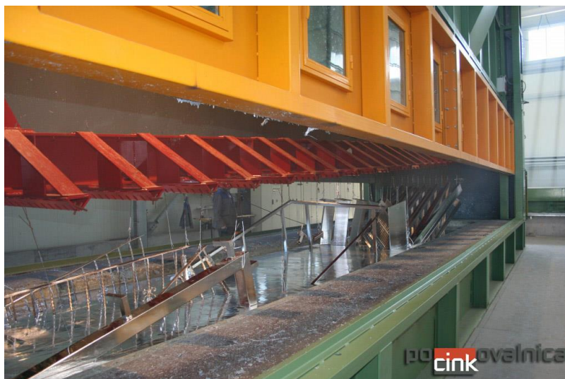
Slike 3.4. Vruće pocinčavanje u otopini cinka [7]