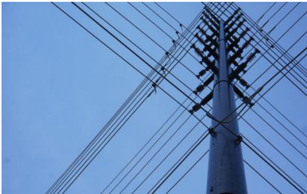
Slika 3.9. Kompozitni stup [12]

Na slici 3.9. prikazan je kompozitni stup.