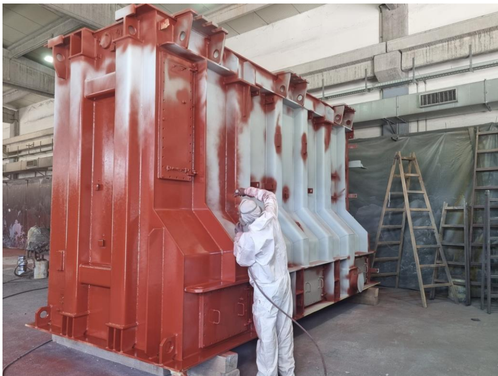
Slika 3.6. Postupak bojanja [8]

Na slici 3.6. prikazan je postupak bojanja, a na slici 3.7. čelik otporan na atmosferske utjecaje.