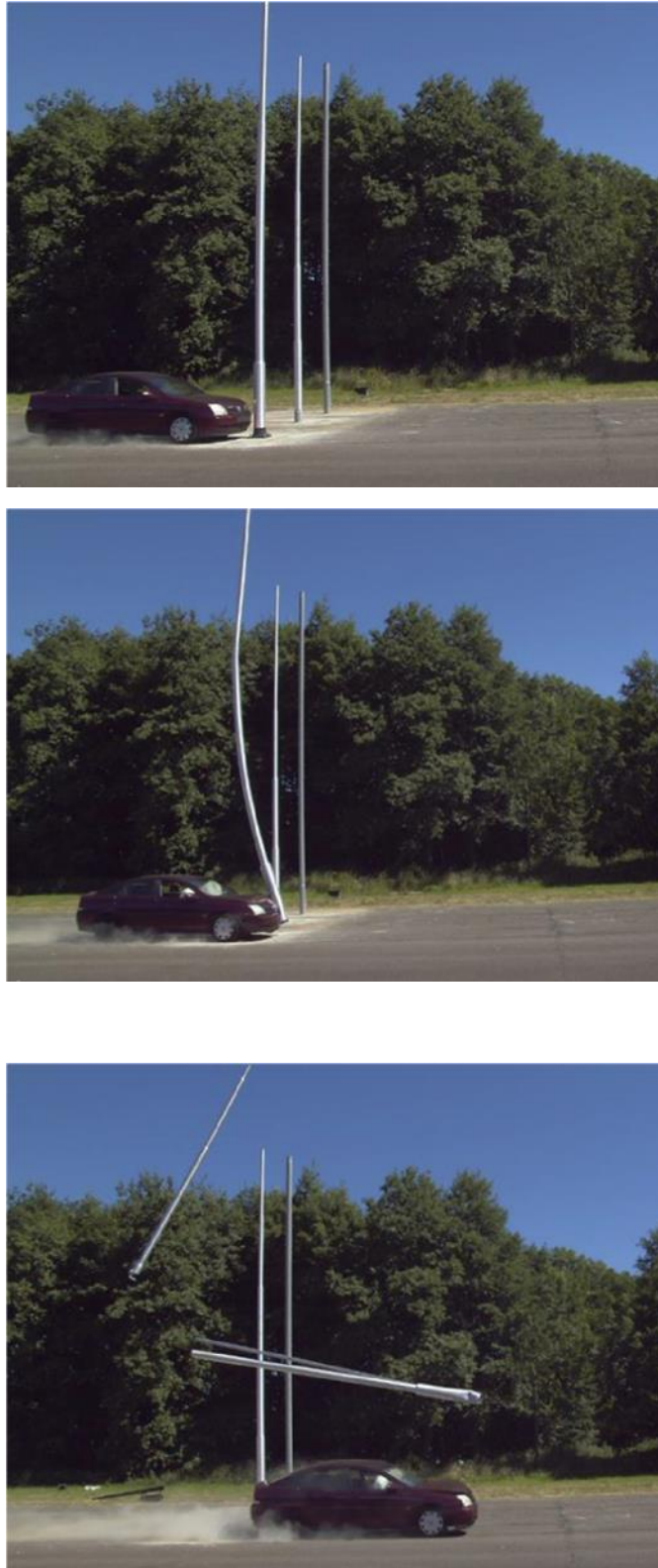
Slika 4.7. Pokusni sudar s NE stupom [16]

Na slici 4.7. prikazan je pokusni sudar s NE stupom.