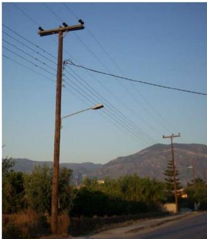
Slika 3.10. Drveni stup [14]